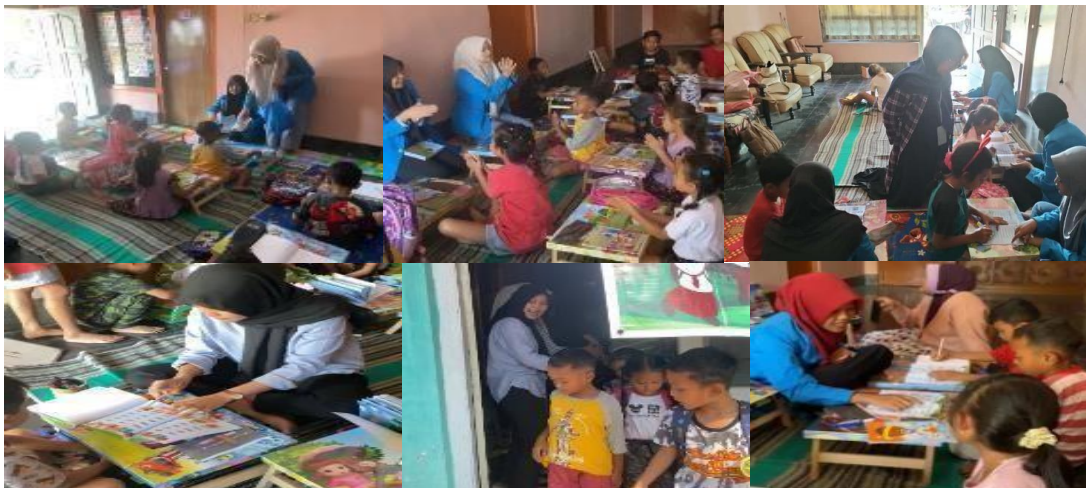
Gambar 9. Cuplikan Kegiatan Posko literasi yang telah dilaksanakan

Peningkatan kemampuan membaca permulaan anak-anak melalui kegiatan posko literasi ini dapat diketahui dengan cara membandingkan perolehan prosentase