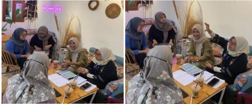
Gambar 10. Evaluasi Kegiatan dan Pembuatan Laporan Akhir Publikasi Artikel

Melakukan evaluasi program dengan menganalisis kendala- kendala yang terjadi di lapangan setelah diadakannya program posko literasi melalui inovasi bahan ajar Abc dengan metode iqro bagi anak-anak tepian hutan Desa Nampu Gemarang Kabupaten Madiun. Tahap terakhir menyusun rencana tindak lanjut. Program ini kedepan diharapkan dapat dilanjutkan oleh mitra.