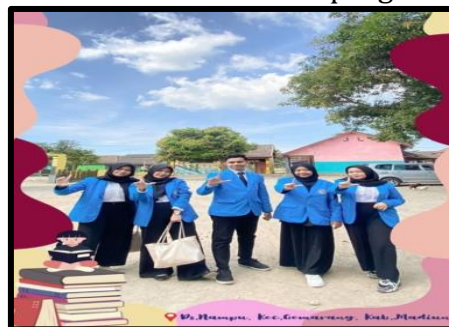
Gambar 3. Survei daerah sasaran

Kemudian tim melakukan survei daerah sasaran, tim melakukan kunjungan di daerah sasaran agar mengetahui kondisi dan keadaan yang ada di lingkungan Desa Nampu Gemarang sebelum melaksanakan program.