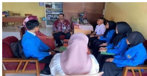
Gambar 6. Perencanaan Kegiatan Sosialisasi pada Anggota Mitra

Dalam perencanaan sosialisasi. Tim pengabdian masyarakat membuat jadwal sosialisasi yang akan dilaksanakan bersama mitra. Karena kegiatan ini akan melibatkan anak-anak yang kebetulan di sekolah di SDN Nampu 5 maka tim melakukan koordinasi dengan pihak sekolah untuk rencana sosialisasi dengan walimurid. Pada alangkah ini, tim Bersama mitra menentukan hari, tanggal dan waktu untuk sosialisasi serta pelaksanaan pendampingan dan bimbingan membaca di posko literasi yang akan didirikan.