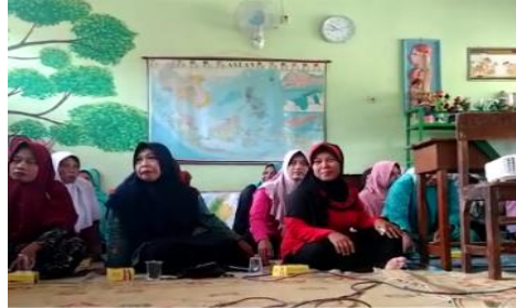
Gambar 7. Sosialisasi Program

Sosialisasi program dan pengenalan kepada mitra yaitu siswa dengan wali murid dan guru di SDN Nampu 5. Tim menjelaskan seberapa pentingnya tentang keterampilan membaca bagi anak-anak, menjelaskan terkait kegiatan posko literasi yang akan dilaksanakan serta menentukan hari pelaksanaan setiap minggunya selama 2 bulan.