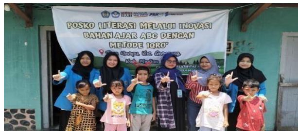
Gambar 8. Tim di depan lokasi pendirian Posko Literasi

Pelaksanaan posko literasi melalui kegiatan bimbingan membaca dengan mengumpulkan 15 anak-anak mitra di salah satu rumah mitra yang bersedia rumahnya digunakan sebagai posko setiap hari sabtu selama 2 bulan dimulai dari bulan September samapai Oktober.