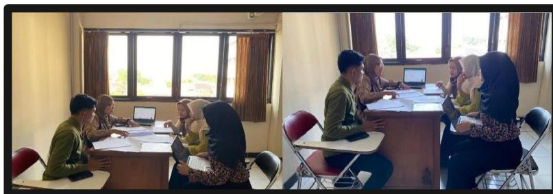
Gambar 2. Diskusi penentuan daerah sasaran

Kemudian tim melakukan survei daerah sasaran, tim melakukan kunjungan di daerah sasaran agar mengetahui kondisi dan keadaan yang ada di lingkungan Desa Nampu Gemarang sebelum melaksanakan program.