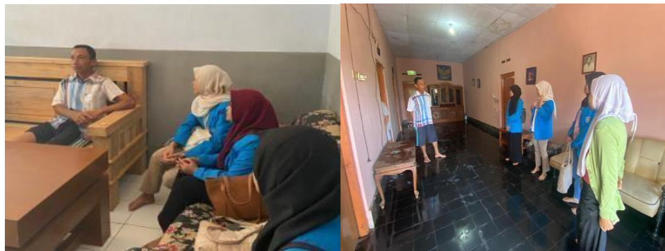
Gambar 5. Perijinan pada ketua mitra dan penjelasan pelaksanaan