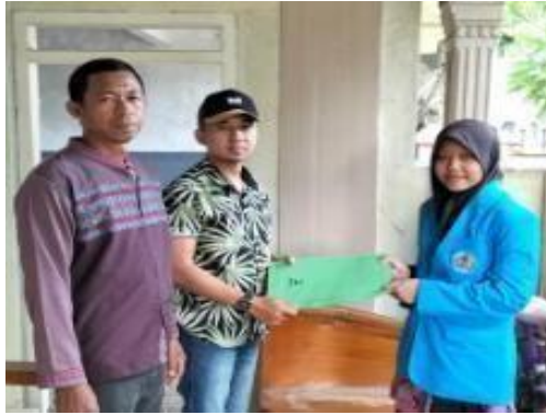
Gambar 4. Perijinan pada pihak Desa melalui kepala Dusun