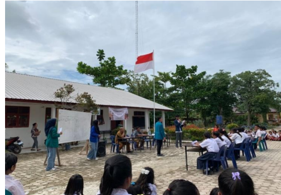
Gambar 6. Kegiatan Cerdas Cermat Ceria