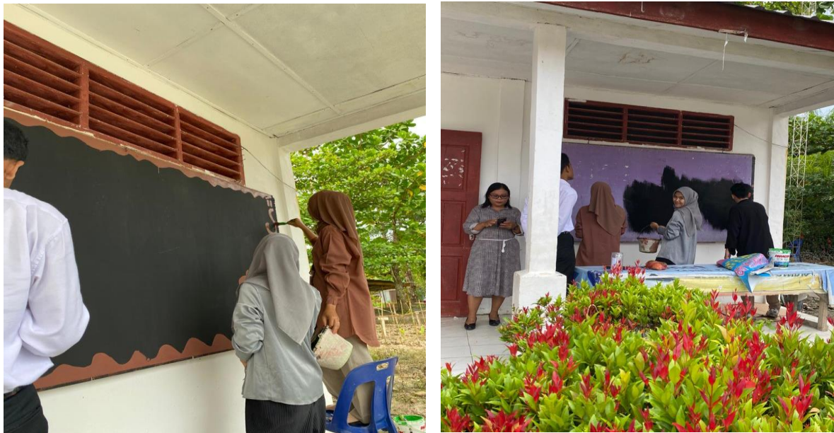
Gambar 8. Kegiatan pendesainan majalah dinding

Hasil kegiatan pada pelaksanaan Program Kampus Mengajar di SMPS Advent Sei Pelancang menunjukkan ketercapaian tujuan yang sangat baik. Setiap program kerja yang telah disusun berhasil terlaksana dengan efektif, membawa dampak positif terhadap peserta didik. Beberapa dampak yang terlihat jelas antara lain: