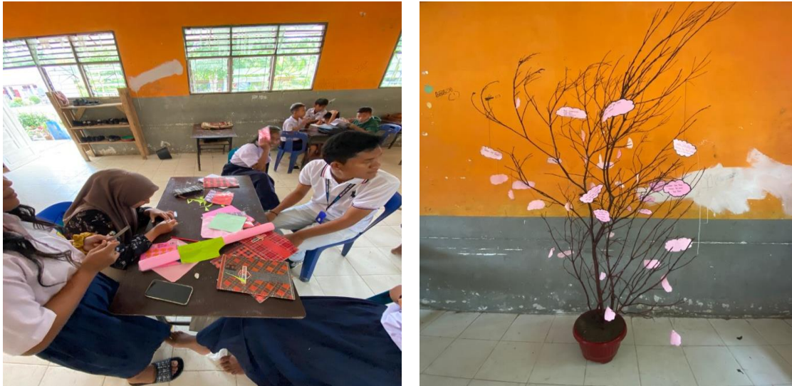
Gambar 9. Kegiatan Pembuatan Pohon Literasi

Menurut Idris Apandai dan Sri Rosdianawati (2021), pohon literasi berfungsi sebagai representasi visual dari berbagai materi atau buku yang telah dibaca oleh siswa, di mana daun-daun pohon tersebut mencerminkan judul-judul buku atau topik yang dipelajari. Sementara itu, menurut Nurhayati dkk (2018), tujuan utama pohon literasi adalah untuk membangun kreativitas peserta didik dan memotivasi mereka untuk terus membaca, menjadikan kegiatan membaca sebagai kebiasaan dalam kehidupan sehari-hari. Dengan demikian, pohon literasi tidak hanya berfungsi sebagai sarana pembelajaran tetapi juga sebagai alat untuk membentuk kebiasaan literasi yang kuat pada peserta didik.