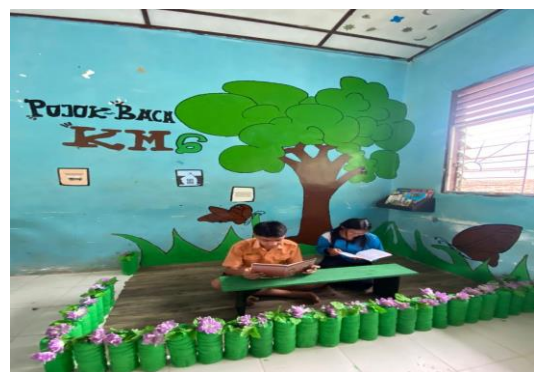
Gambar 7. Pojok Baca