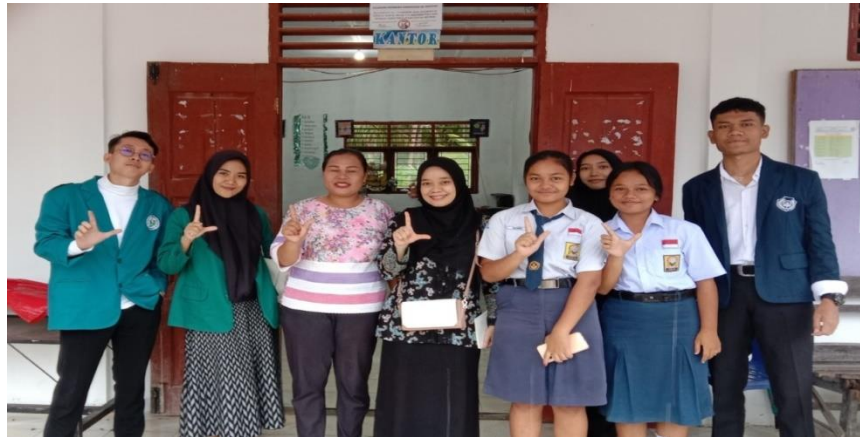
Gambar 3. Kegiatan Penyerahan Mahasiswa Kampus Mengajar di Sekolah Penugasan

Pelaksanaan Program Kampus Mengajar dimulai dari tanggal 14 Agustus 2023 sampai dengan penarikan pada tanggal 5 Desember 2023. Selama kurang lebih empat bulan menjalan rangkaian tahapan dalam penugasan mulai dari penyusunan proker, menjalankan semua proker yang sudah mendapat persetujuan dari seberapa pihak mulai dari anggota tim, pihak sekolah tempat penugasan hingga dari Dosen Pembimbing lapangan.