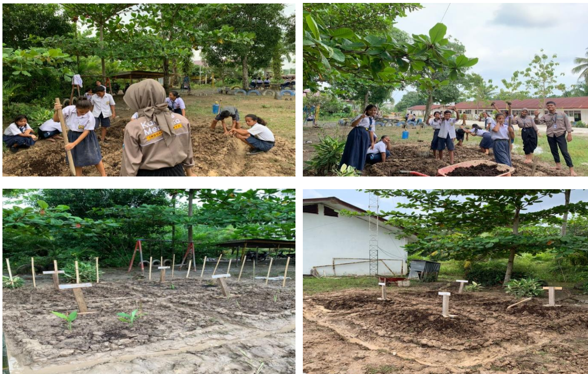
Gambar 8. Kegiatan Apotek Hidup

Program Kerja Apotek Hidup adalah inisiatif yang memanfaatkan lahan kecil di sekitar kelas untuk menanam berbagai jenis tanaman obat. Tanaman-tanaman yang ditanam, seperti kunyit, sereh, lidah buaya, dan lengkuas, tidak hanya berguna untuk kebutuhan sehari-hari, tetapi juga mendukung pembelajaran literasi sains. Melalui program ini, siswa dapat belajar langsung tentang manfaat tanaman obat, cara merawatnya, serta penerapan sains dalam kehidupan nyata. Program ini juga mendorong kesadaran akan pentingnya keberagaman tumbuhan dan pemanfaatannya dalam pengobatan alami.