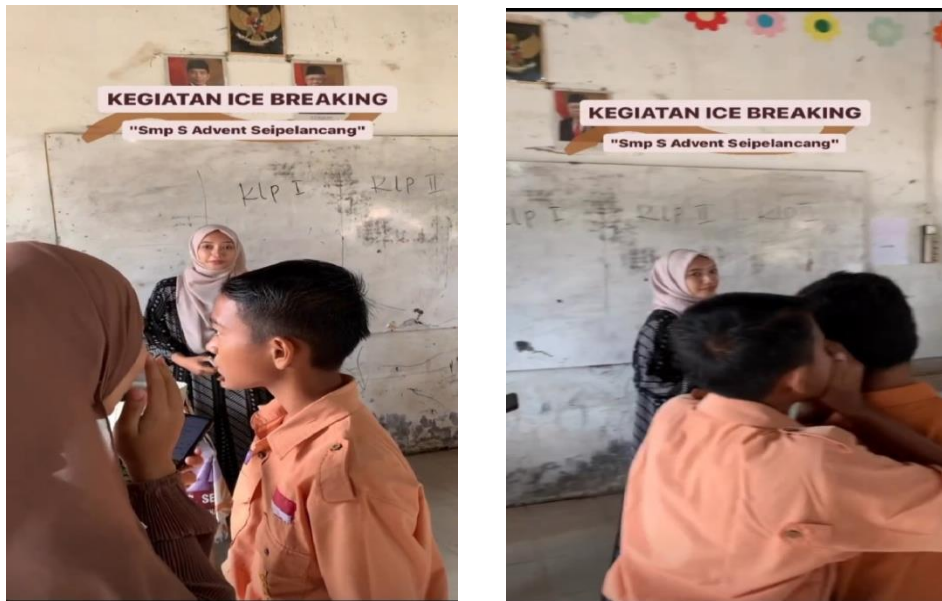
Gambar 4. Kegiatan Ice Breaking selama proses pembelajaran

Dalam pembekalan Program Kampus Mengajar, mahasiswa diberikan amanah untuk melaksanakan berbagai kegiatan yang mendukung proses pendidikan di sekolah. Salah satunya adalah mengajar secara individu ketika guru sedang menghadiri rapat atau berhalangan hadir di sekolah. Selain itu, mahasiswa juga terlibat dalam kegiatan rutin di sekolah, seperti upacara pada Hari Senin, ibadah rohani bersama para siswa dan guru-guru setiap Selasa hingga Kamis, serta senam pada hari Jumat dan Sabtu. Keterlibatan mahasiswa dalam kegiatan-kegiatan ini bertujuan untuk mendukung pembelajaran dan mempererat hubungan antara mahasiswa, siswa, serta guru di sekolah.