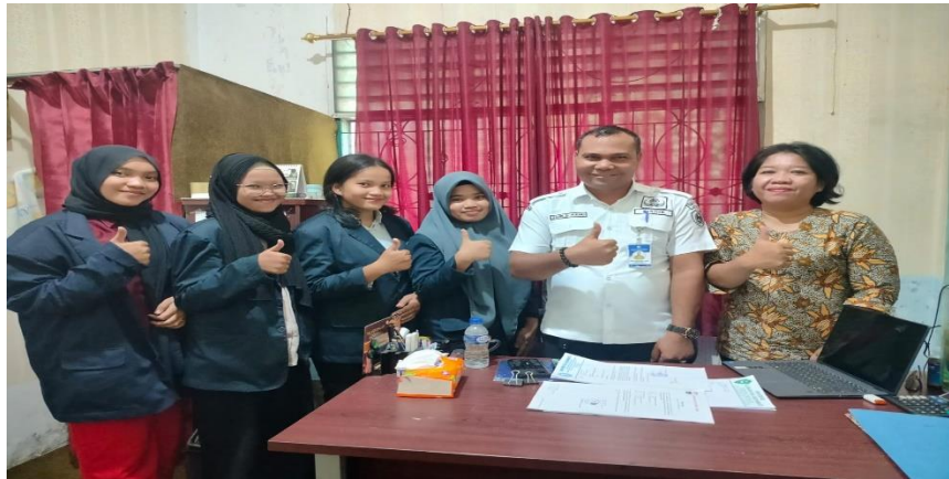
Gambar 1. Laporan diri mahasiswa dan DPL ke Kantor Dinas Pendidikan Kab. Labuhan Batu

Observasi awal yang dilakukan di sekolah bertujuan untuk mendapatkan gambaran menyeluruh mengenai kondisi lingkungan sekolah, situasi internal, serta keadaan siswa-siswi. Proses ini menjadi dasar penting dalam menyusun program kerja yang relevan selama masa penugasan. Mengingat lokasi sekolah yang cukup jauh, sekitar 435 km, observasi dilakukan secara daring dengan melibatkan kepala sekolah sebagai narasumber utama. Sementara itu, koordinasi dan pelaporan kegiatan Kampus Mengajar dengan Dinas Pendidikan Kabupaten Labuhan Batu dilakukan melalui perwakilan mahasiswa dan Dosen Pembimbing Lapangan (DPL) dari Perguruan Tinggi yang berada di Kabupaten Labuhan Batu. Pendekatan ini diharapkan dapat memastikan kelancaran komunikasi dan pelaksanaan program, meskipun terdapat keterbatasan jarak.