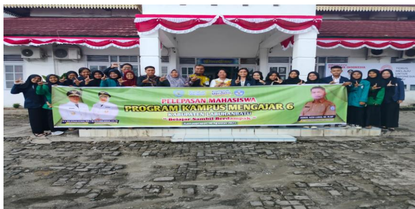
Gambar 2. Kegiatan Pelepasan Mahasiswa Kampus Mengajar

Pembekalan dilaksanakan online melalui dua platform yaitu siaran live Youtube dan melalui daring Zoom Meeting, yang dilaksanakan kurang lebih selama tiga minggu. Materi yang disampaikan adalah pemahaman serta penjelasan terkait program juga semua tahap-tahap pada saat penugasan dilaksanakan.