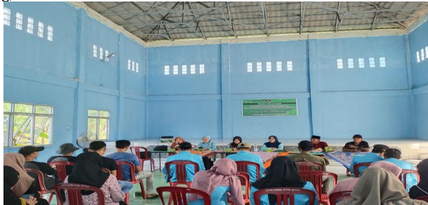
Gambar 1 Pemberian Materi

Pada pembahasan ini, pembicara mengajar masyarakat yang hadir dalam kegiatan pengabdian masyarakat berbentuk sosialisasi ini, untuk membagi skala-skala kebutuhan konsumsi dalam hidup. Terkhusus untuk kaum milenial, agar bisa mengatur dan memanajemen keuangan sejak dini. Usia 22 tahun – 33 tahun merupakan masa produktif bagi manusia untuk menghasilkan uang, di masa demikian juga merupakan tantangan bagi kaum milenial, disaat masa produktif menghasilkan uang, juga di masa ingin mendapatkan sesuatu dengan alasan sebagai Self Reward . Tanpa memikirkan investasi terlebih dahulu. Self Reward yang tidak terkontrol dapat menyebabkan perilaku konsumtif dan boros. Hasil komunikasi dengan masyarakat dalam seminar ini, memberikan gambaran . Bahwasanya, kemudahan transaksi di era sekarang dalam hal belanja, membuat masyarakat mengalami perubahan kultur baru dalam berbelanja. Terlebih dengan tawaran promosi dan harga murah yang setiap saat bisa di akses pada genggamannya smartphone masing-masing. Membuat pengeluaran bulanan masyarakat sering tidak terkontrol. Kajian dan pembahasan pada seminar ini tentang proses perencanaan dan pengelolaan keuangan islami ini bertujuan bukan hanya untuk kepentingan dan kepuasan diri untuk memiliki dan mendapatkan suatu benda. Namun, harusnya adanya pembagian yang seimbang, untuk dunia dan akhirat.