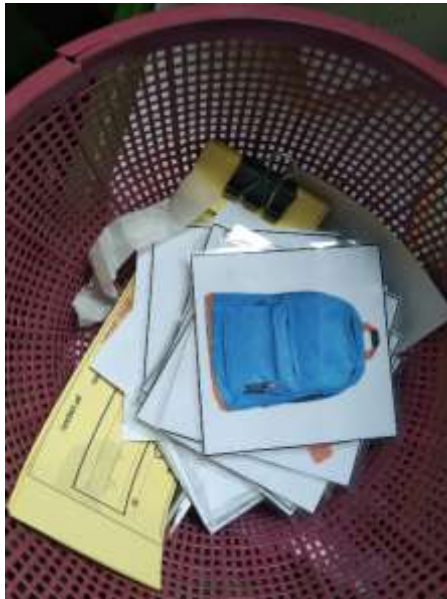
Gambar 3. Media Flashcard