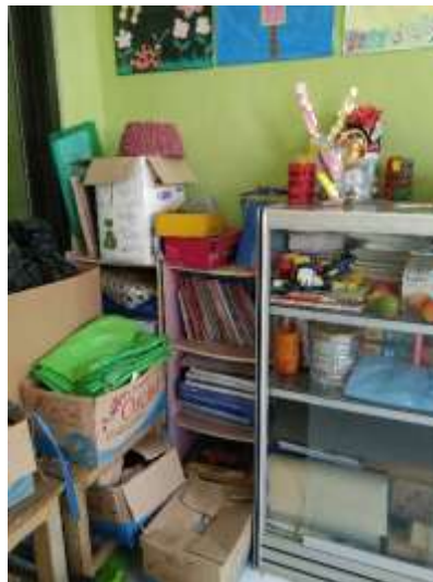
Gambar 1. Pojok Literasi

Beberapa dokumentasi mengenai media pembelajaran, arsip nilai, dan kondisi ruang kelas siswa tunarungu.