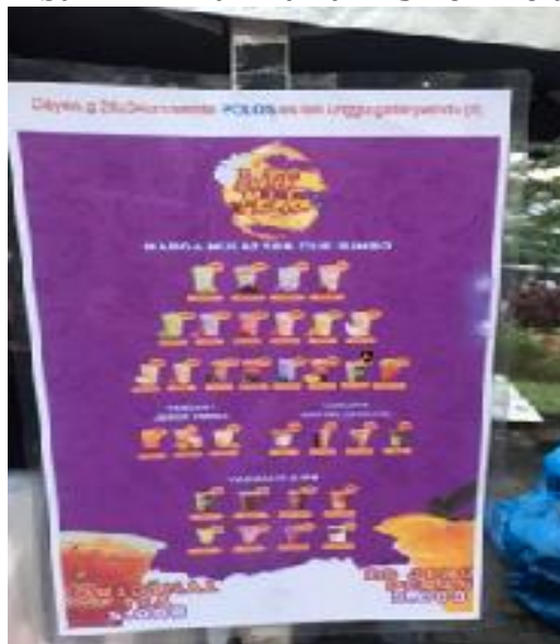
Gambar 2. Menu Varian ES Teh Melatie

UMKM Es Teh Melatie Jambi hadir untuk memenuhi kebutuhan masyarakat Jambi akan minuman segar yang dapat dinikmati di berbagai kesempatan. Sebagai usaha yang baru, Es Teh Melatie Jambi berfokus pada penyediaan minuman berkualitas dengan rasa yang khas dan menyegarkan. Dengan berfokus pada minuman yang segar dan variatif, Es Teh Melatie Jambi berhasil menarik perhatian masyarakat sekitar yang mencari alternatif minuman yang menyegarkan, terutama di tengah cuaca panas. Produk yang ditawarkan pun beragam, mulai dari es teh original, jeruk peras segar, hingga berbagai varian rasa es teh yang disesuaikan dengan selera konsumen.