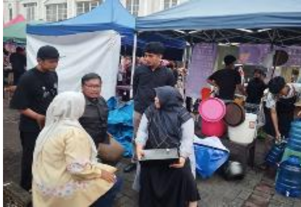
Gambar 3. Membantu Peningkatan Aplikasi SIAPIK

laporan keuangan, dan analisis keuangan secara menyeluruh. Peserta diberi kesempatan untuk langsung mempraktikkan penggunaan aplikasi SIAPIK dengan menginput data transaksi, melihat arus kas, dan menghasilkan laporan keuangan yang berguna bagi pengelolaan usaha. Mengakhiri sesi pelatihan dengan sesi tanya jawab untuk menjawab berbagai pertanyaan dari mitra dan memberikan solusi atas permasalahan yang dihadapi dalam penggunaan aplikasi SIAPIK. Dapat dilihat pada Gambar berikut ini :