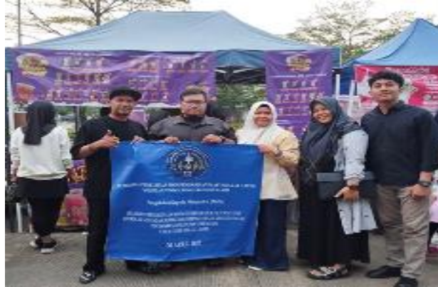
Gambar 7. Foto Bersama Pemilik Es Teh Melatie

Kegiatan pengabdian kepada masyarakat (PKM) ini berjalan dengan sangat lancar. Pemilik usaha Es The Melatie turut memfasilitasi mempersiapkan tempat pelaksanaan PKM. Adapun output yang didapat dari kegiatan pengabdian masyarakat (PKM) ini antara lain mitra pelatihan mendapatkan wawasan dan teknik digitalisasi dalam menyusun laporan keuangan untuk kegiatan usaha yang dijalankan. Kegiatan pengabdian diakhiri dengan foto bersama seperti terlihat pada gambar berikut :