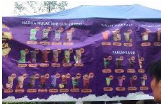
Gambar 1. Pilihan Varian ES Teh Melatie

yang bergerak dibidang minuman yang menjual esteh, jeruk peras dan es teh varian rasa yang dikelola oleh bapak Kurniawan sejak tahun 2023.