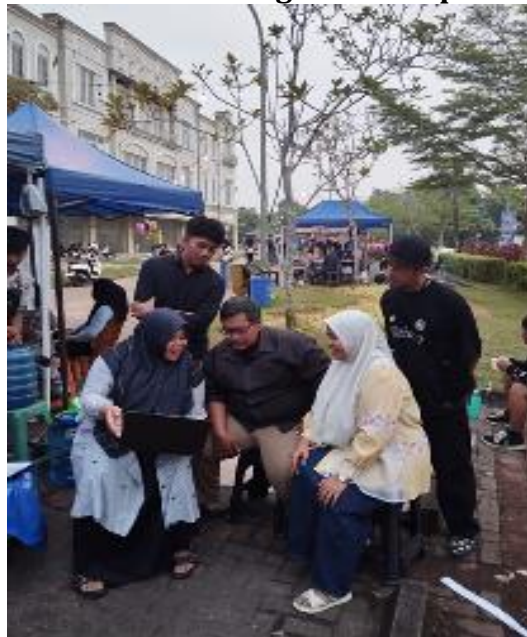
Gambar 4. Memaparkan Materi

Mitra pelatihan diharapkan dapat memahami dan menguasai cara mengelola keuangan usaha secara lebih efisien dengan menggunakan aplikasi SIAPIK. Dengan penggunaan aplikasi ini, pengelolaan keuangan di Es Teh Melatie diharapkan lebih transparan, akurat, dan terstruktur, yang membantu dalam pengambilan keputusan bisnis yang lebih baik. Sistem otomatisasi yang ditawarkan oleh aplikasi SIAPIK, proses pencatatan dan pelaporan keuangan dapat dilakukan dengan lebih cepat dan mudah, menghemat waktu dan sumber daya. Dengan pengelolaan keuangan yang lebih baik, usaha minuman seperti Es Teh Melatie dapat meningkatkan stabilitas finansial dan keberlanjutan usaha mereka.