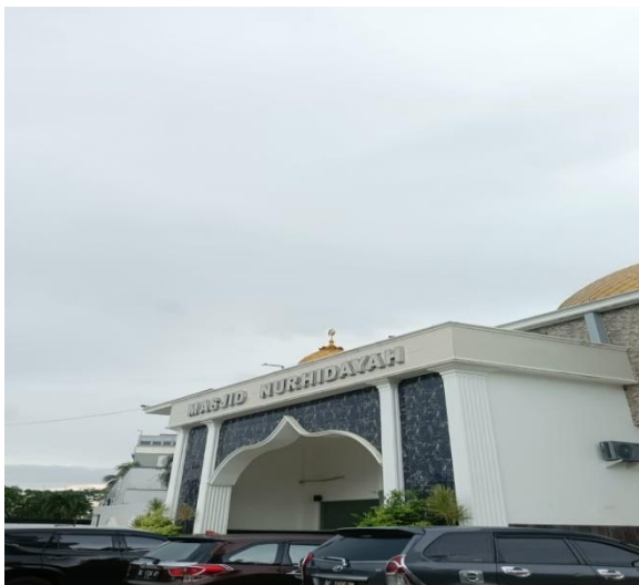
Gambar 1. Masjid NurHidayah- Demang Lebar Daun

Makna ayat tersebut diatas mengandung arti bahwa dalam setiap kesempatan di kehidupan ini, manusia sebagai khalifah tidak boleh lalai dalam mencari rezeki, mengumpulkan harta dengan melakukan segala sesuatu yang penuh dengan kemudharatan, antara lain, sumpah palsu, mencuri, melakukan suap menyuap, praktik riba, merampas, menipu dan alasan lainnya yang bermaksud tujuan memakan harta milik segolongan manusia dengan cara batil serta melakukan perbuatan dosa. Dalam Pengabdian kepada Masyarakat ini dilengkapi dokumen berupa photo dan video, namun yang hanya dapat diakses dalam artikel ini hanya berupa dokumen photo.