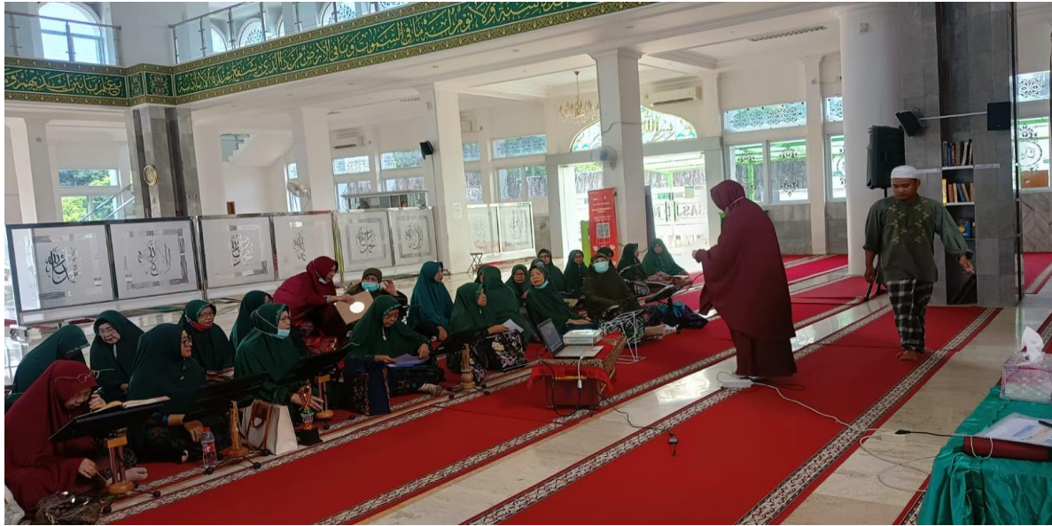
Gambar 3. Suasana Dialog Inter aktif dalam kegiatan Pengabdian kepada Masyarakat