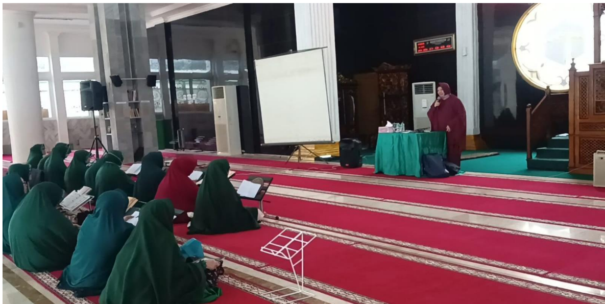
Gambar 4. Tanya Jawab antara Pemateri dengan Para Jama'ah