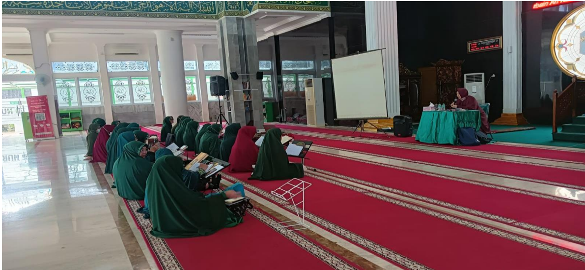
Gambar 5. Situasi dan Kondisi Kajian Ilmu