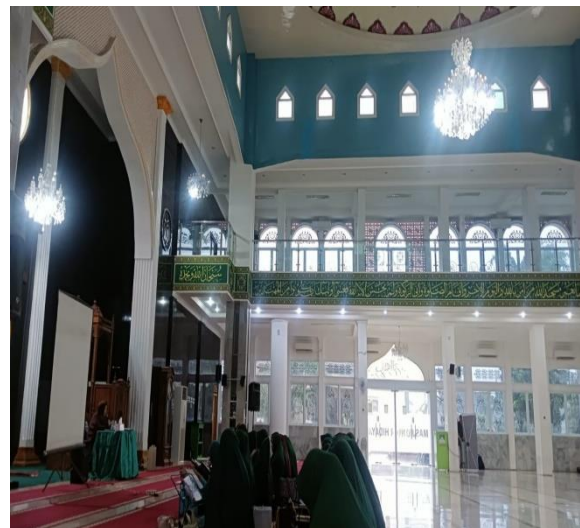
Gambar 2. Dr.Ir.Hj. Herlina, M.E. - Pemateri