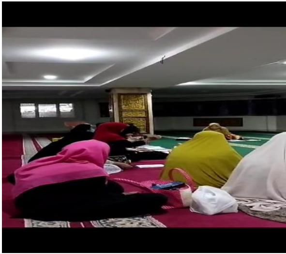
Gambar 3. Merangkai Pertanyaan