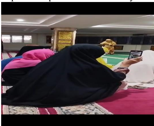
Gambar 1. Pemateri

Kegiatan Pengabdian kepada Masyarakat ini dilengkapi photo dan video, namun dapat ditampilkan artikel ini hanya berupa dokumen photo.