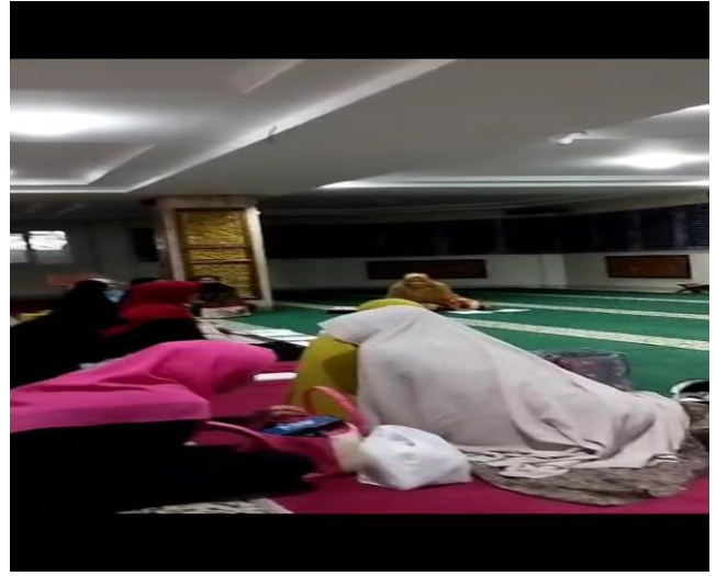
Gambar 4. Diskusi Antar Jama'ah.

Pada prinsipnya, masalah syariah merupakan problem muamalah dan ibadah yang terjadi pada masyarakat muslim di kehidupan sehari-hari. Pada artikel (Novendri S et al., 2022) lebih dijelaskan tentang aktualisasi moderasi Islam pada permasalahan syariah. Dalam kajian artikel tersebut digambarkan mengenai moderasi Islam pada syariah permasalahan di era 4.0. Di artikel disimpulkan bahwa Islam moderasi dari perspektif syariah dapat dikelompok menjadi 3 (tiga) aspek, antara lain meringankan beban ( taklil al-taklif ), memperlancar urusan ( 'adam al-harj ) dan melaksanakan hukum secara bertahap ( altdarraaj al-tasyri' ). Pada era 4.0 kembali diaktifkannya moderasi Islam sebagai manifestasi penerapan konsep moderasi Islam berbasis syariah dalam mengikuti perkembangan zaman, dengan memperhatikan prinsip-prinsip dan berbagai aspek dalam memahami Islam.