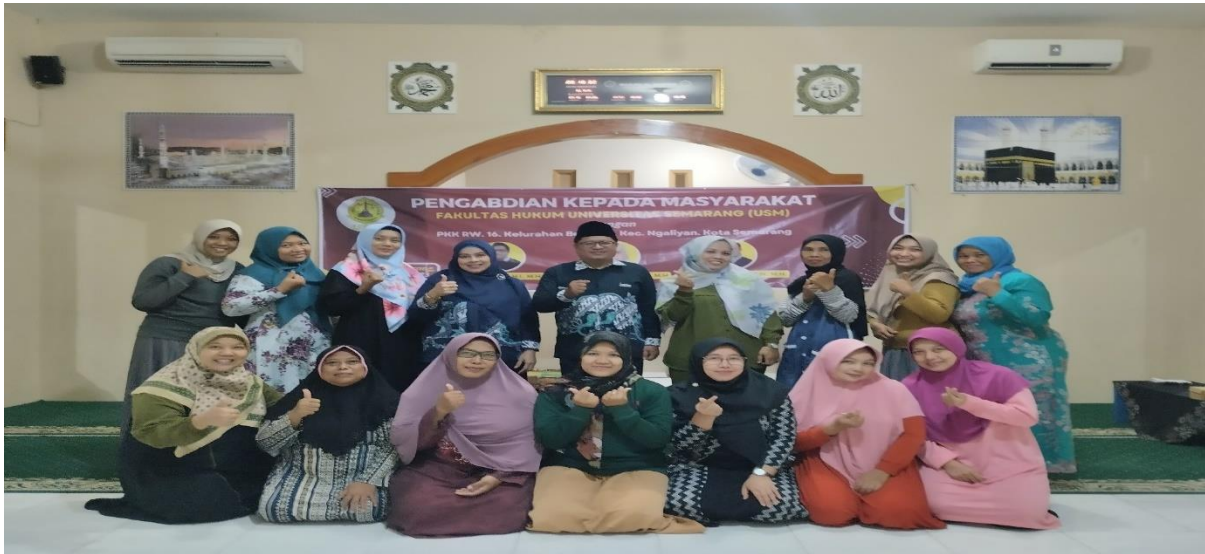
Gambar 1. Peserta Pengabdian Kepada Masyarakat