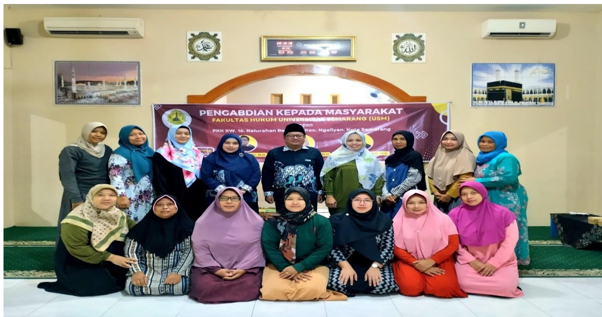
Gambar 2. Peserta Pengabdian Kepada Masyarakat