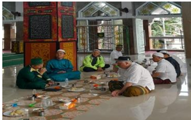
Gambar 3. Sebagian Jamaah