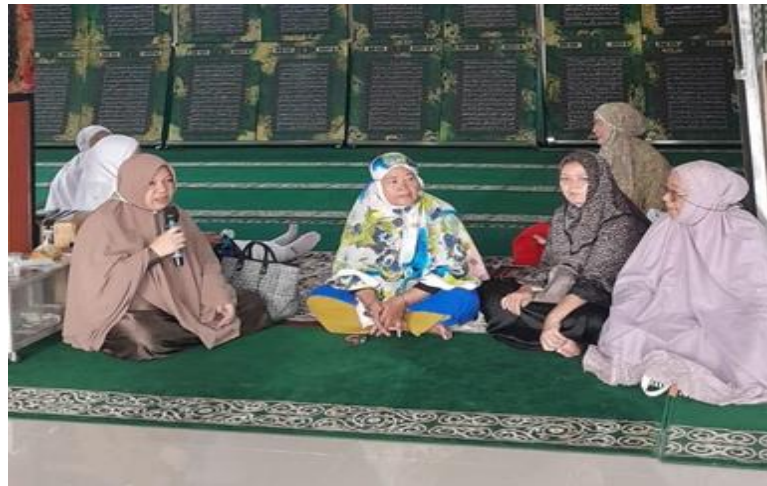
Gambar 2. Sesi Tanya Jawab