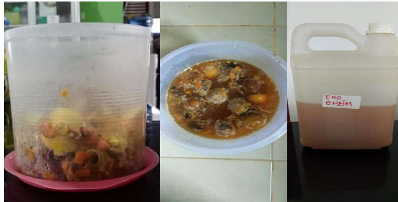
Gambar 4. Produk Ekoenzim