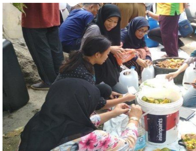
Gambar 3. Proses Pembuatan Ekoenzim