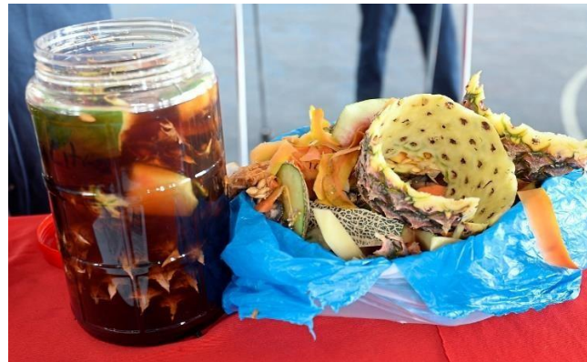
Gambar 3. Bahan Pembuatan Ekoenzim