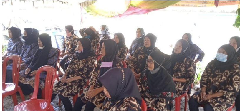
Gambar 2. Peserta Sosialisasi Ekoenzim

kuisisioner yang disebar, tingkat pengetahuan peserta hanya sebesar 38,5 %. Setelah mendengarkan paparan dan melihat langsung pembuatan ekoenzim dari pemateri, tingkat pengetahuan peserta sosialisasi mengenai pemanfaatan sampah organik rumah tangga menjadi ekoenzim meningkat menjadi 95,8 %.