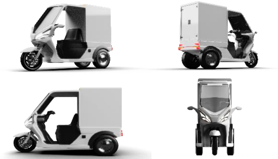
Gambar 2 3D Modeling Sepeda Listrik 3 Roda