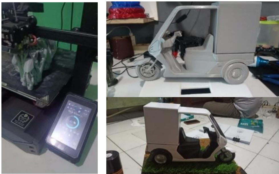
Gambar 3 Prototype Sepeda Listrik 3 Roda