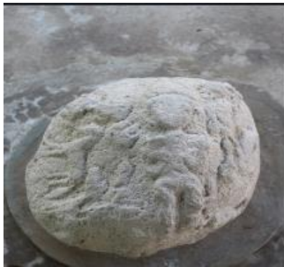
Gambar 1 Situs Batu Berelief Muak

Supaya karya yang dihasilkan lebih maksimal, maka pada proses penciptaan diawali dengan melakukan pengamatan baik secara langsung maupun melalui gambar-gambar yang terdapat di dalam buku, majalah, internet, sebagai acuan dalam pembuatan karya ini di antaranya, lihat gambar 1 sampai dengan gambar 8 berikut.