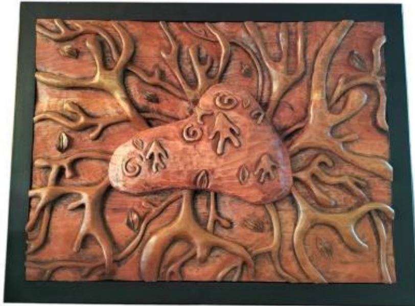
Gambar 9 Karya 1

Karya dua dimensi pada gambar 9 di atas berjudul Zaman Dahulu dengan ukuran karya 60 x 80 cm dan menggunakan teknik Ukir, yang dimana karya ini menceritakan tentang kehidupan zaman dulu bahwa pernah ada kehidupan di zaman dulu sebelum ada zaman sekarang dimana pada zaman dulunya orang mengukir belum menggunakan pahat besi tetapi orang dulu memahat memakai batu yang di ukir berbentuk motif orang pada batu Berelief yang menyimbolkan kehidupan di karya tersebut pengkarya memberi judul zaman dulu pengkarya juga menambahkan bentuk akar yang tumbuh di sekeliling batu yang dimana akar itu juga memiliki makna yaitu menyimbolkan sumber kehidupan yang ada di batu berelief.