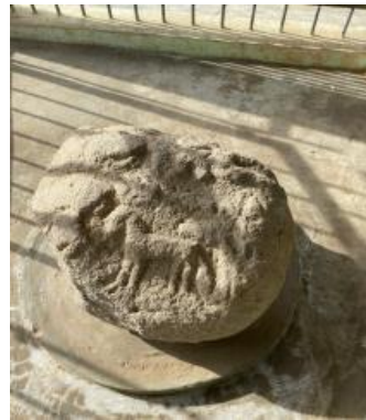
Gambar 2 Situs Batu Berelief Muak