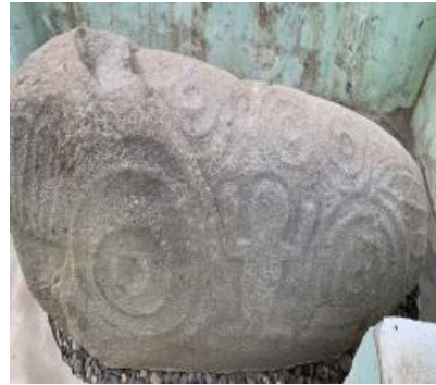
Gambar 4 Situs Batu Selindrik Kumun