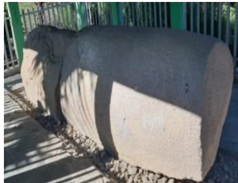
Gambar 6 Situs Batu Selindrik Muak