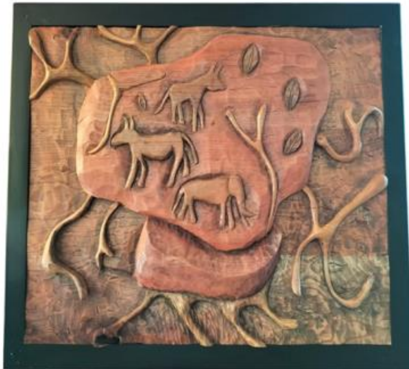
Gambar 11 Karya 3

Karya dua dimensi pada gambar 11 di atas berjudul Kehidupan dengan ukuran karya 60 x 80 cm dan menggunakan teknik Ukir, yang dimana karya ini karya yang di buat menyimbolkan tentang kehidupan zaman dulu dimana pada zaman dulunya orang mengukir belum menggunakan pahat besi tetapi orang dulu memahat memakai batu di karya tersebut orang mengukir pakai batu pengkarya memberi judul zaman dahulu bahwa pernah ada kehidupan pada zaman dulu sebelum ada zaman sekarang pengkarya juga menambahkan bentuk kehidupan di motif batu Berelief tersebut.