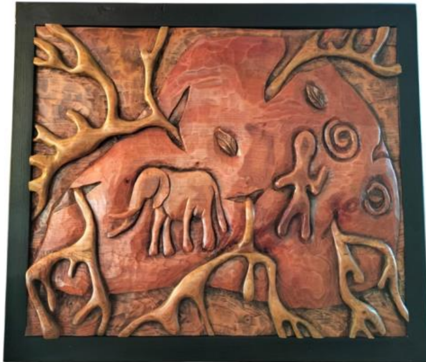
Gambar 12 Karya 4

Karya dua dimensi pada karya 12 di atas berjudul Tak Terawat dengan ukuran karya 60 x 80 cm dan menggunakan teknik Ukir, yang dimana karya ini dibuat berbentuk batu yang sudah di tumbuhi akar dimana sebelum ada zaman modern Batu tersebut tidak di rawat dan pengkarya menambahkan bentuk motif gajah dan daun dan motif spiral motif tersebut di jadikan objek pendukung pada karya tersebut dan akar yang keluar dari batu tersebut menyimbolkan bahwa batu tersebut tidak di rawat dan di lindungi oleh masyarakat sekitarnya.