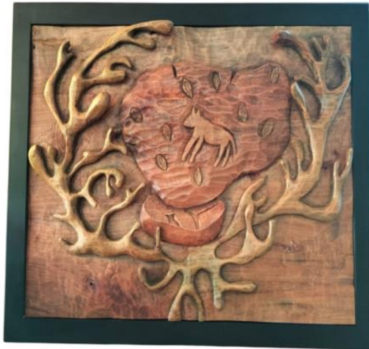
Gambar 14 Karya 6

Karya dua dimensi Pada karya 14 di atas berjudul Dilindungi dengan ukuran karya 60 x 80 cm dan menggunakan teknik Ukir, yang dimana batu tersebut masih di lindungi oleh masyarakat setelah masuknya zaman modern dan masih di juga dan dilestarikan pada karya tersebut terdapat akar kayu yang keluar dari bawah batu yang dimna akar tersebut menyimbolkan bahwa batu tersebut di lindungi oleh masyarakat setempat dan di batu tersebut juga terdapat motif dan daun batu Berelief sebagai objek pendukung pada karya tersebut.