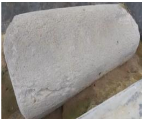
Gambar 7 Situs Batu Selindrik Jujun