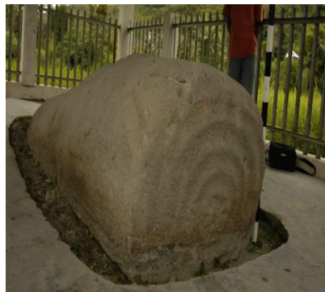
Gambar 8 Situs Batu Selindrik Lempur Mudik