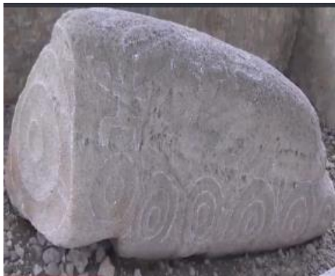
Gambar 5 Situs Batu Selindrik Lolo Gedang