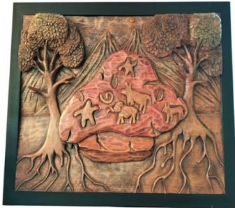
Gambar 10 Karya 2

Karya dua dimensi pada gambar 10 di atas berjudul Kehidupan dan Alam dengan ukuran karya 60 x 80 cm dan menggunakan teknik Ukir, yang dimana karya ini menceritakan tentang kehidupan yang pernah ada zaman purba yang di ukir oleh leluhur untuk memperlihatkan lewat batu berelief bahwa ad kehidupan manusia dan hewan pada zaman masa lalu dan disana juga pengkarya menambahkan di sekelilingnya ada gunung dan bulan sebagai objek pendukung dan pohon yang dimana gunung tersebut menyimbolkan bahwa batu tersebut terletak di pegunungan yang ada di kerinci dan pohon dan tumbuhan alam yang dimana menyimbolkan tentang bahwa orang di zaman purba dulu hidup di lingkungan alam atau di hutan.