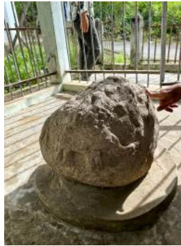
Gambar 3 Situs Batu Berelief Muak