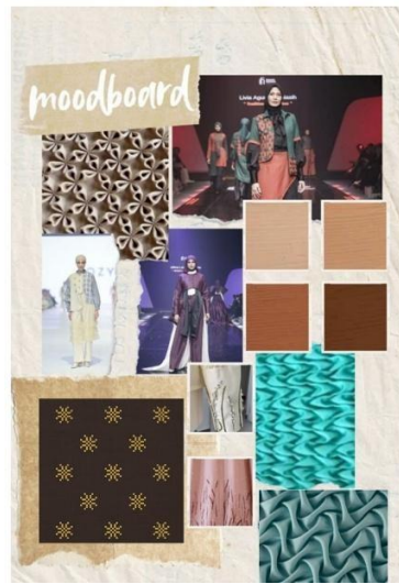
Gambar 1. Moodboard