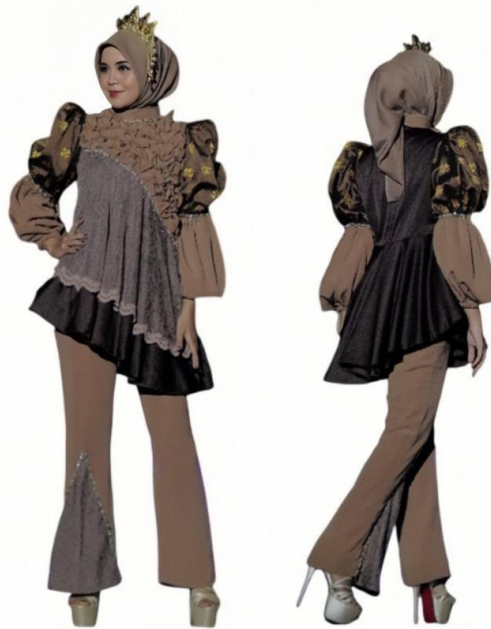
Gambar 5. Hasil Karya

Dalam pembuatan karya busana tentu perlu melakukan tinjauan karya yang bertujuan untuk menemukan perbandingan dan inspirasi baru pada karya yang dibuat. Dalam bagian ini mencantumkan tinjauan karya terdahulu dengan karya yang dibuat. Untuk menjaga suatu keaslian karya terdapat beberapa karya yang berhubungan dengan busana kontemporer dengan teknik smock jepang untuk menjadi pembandingan dengan karya yang dibuat. Pada busana ini merujuk pada karya ready to wear deluxe karya desainer Josephine Theodora dan Dewi Isma Aryani yang dijadikan sebagai pembandingan. Persamaan terdapat pada penggunaan celana serta penerapan teknik smock sebagai elemen desain perbedaan signifikan yaitu pada atasan dan penggunaan bahan. Desainer ini menggunakan katun toyobo sedangkan pengkarya menggunakan wastra songket melayu Riau yang kaya dengan nilai budaya dan visual. Selain itu, teknik butik digunakan untuk memperkuat kualitas dan ketelitian hasil.