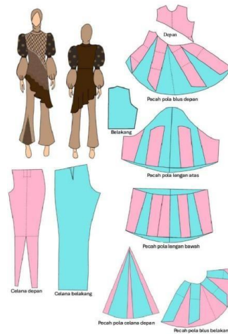
Gambar 3. Pecah Pola 1:4

Pembuatan pecah pola 1:4 bertujuan agar detail dan pecahan pola pada desain dapat digambar dengan mudah dan meminimalisir terjadi kesalahan pada saat memproduksi pembuatan pola dengan ukuran 1:1 (lihat Gambar 3).