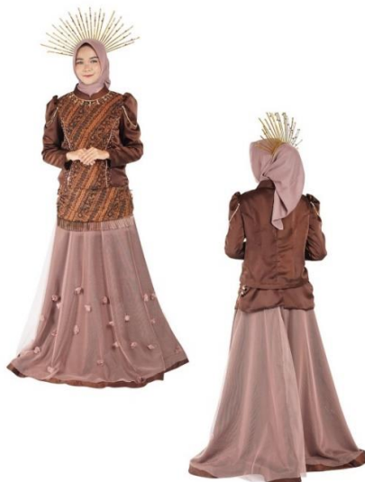
Gambar 5. Hasil Karya

Sementara pada karya yang diciptakan menggunakan bahan batik dengan kombinasi kain maxmara . Pengkarya menggunakan siluet A pada bagian rok yang dikombinasikan dengan kain tule. Untuk memberikan kesan estetis, pengkarya menggunakan teknik hias korsase dan teknik hias sulam payet. Persamaan karya designer Kursein Karzai dengan karya yang diciptakan terletak pada bagian blus menggunakan teknik hias sulam payet, pada bagian rok mengembang dengan kombinasi tule, perbedaannya bentuk busana pada blus dimodifikasi, dan bahan yang digunakan pada bagian kerah. Karya designer Kursein Karzai ini menjadi rujukan untuk tingkatan busana ready to wear deluxe .