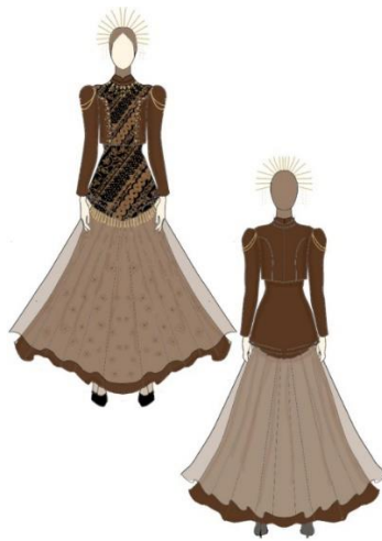
Gambar 2. Desain Busana Kontemporer dengan batik motif saik galamai

Berdasarkan dari kedua pendapat diatas, dapat dipahami teknik ini sering kali melibatkan pengerjaan tangan untuk hasil yang lebih personal dan premium. Oleh sebab itu, pengkarya merancang desain busana dengan potongan yang mewah setingkat dari ready to wear . Pada rancangan busana ready to wear deluxe ini, pengkarya membuat detail dan siluet modern dengan menggunakan bahan maxmara coklat dan organza krem. Pemakaian bahan kain ini dikombinasikan batik motif saik galamai dengan menggunakan potongan siluet A. Untuk memberikan kesan mewah setingkat dari ready to wear , maka pengkarya membuat bagian busana rok dan blus dengan menambahkan teknik hias sulam payet dan korsase (lihat gambar 2).