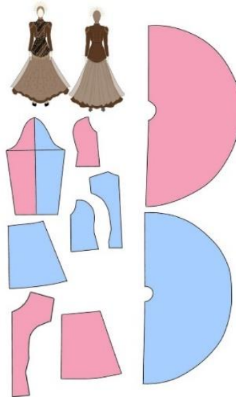
Gambar 3. Pecah pola 1:4