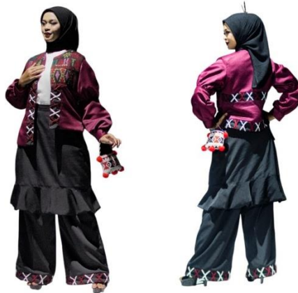
Gambar 5. Hasil karya

Karya pada gambar 5 diatas berjudul Saroha merupakan jenis busana ready to wear yang mengaplikasikan ornamen jagar-jagar Mandailing dengan menggunakan exotic dramatic style . Saroha dalam bahasa Mandailing yang memiliki arti sehat, kesatuan dan harmoni. Busana ini menggambarkan keharmonisan antara budaya Mandailing dengan gaya modern yang dijadikan dalam satu karya busana. Karya ini menggunakan ukuran standar L yang terdiri dari empat potongan busana, yaitu inner , outer , rok dan celana. Unsur garis vertikal dan horizontal ditempatkan pada penerapan ornamen jagar-jagar . Unsur garis vertikal terletak dibagian pinggir depan outer . Garis horizontal terletak pada bagian belakang outer yang merupakan representasi dari bentuk aslinya yang umum diaplikasikan pada bagian tutup ari bagas godang .