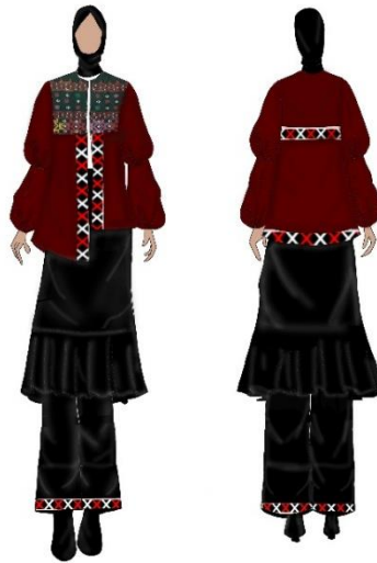
Gambar 2. Desain busana ready to wear