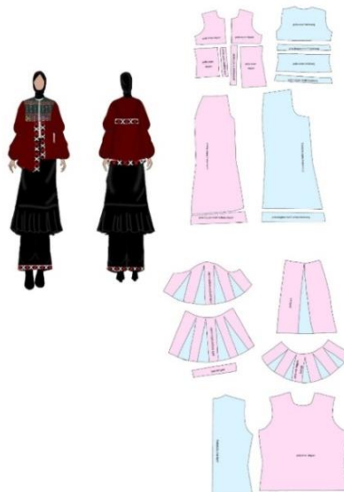
Gambar 3. Pembuatan pola 1:4

Pembuatan pecah pola 1:4 merupakan kegiatan yang dilakukan untuk mengembangkan pola dasar agar sesuai dengan contoh yang dikehendaki. Pembuatan pola ini dibuat untuk meminimalisir terjadinya kesalahan pada saat pembuatan pola 1:1, dan mengetahui banyaknya bahan yang dibutuhkan dalam pembuatan busana, lihat gambar 3.