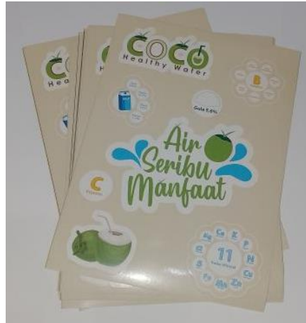
Gambar 16 Stiker