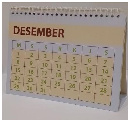
Gambar 11 Kalender