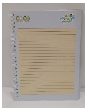
Gambar 12 Kalender