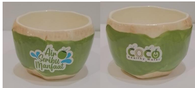
Gambar 17 Mug