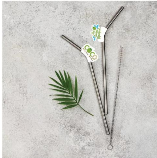
Gambar 13 Sedotan