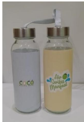
Gambar 14 Tumbler