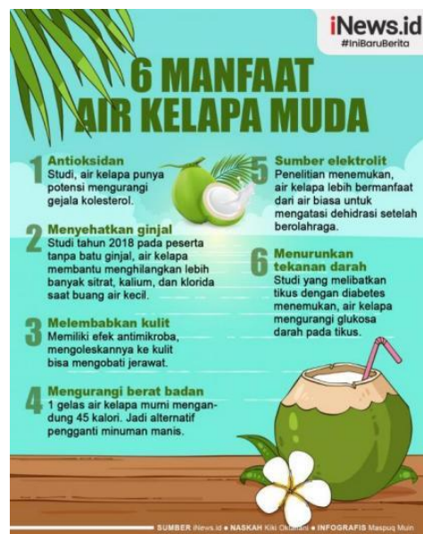
Gambar 1 Poster 6 Manfaat Minum Air Kelapa Muda