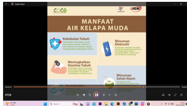
Gambar 2 Video Animasi