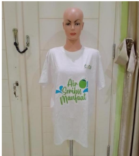
Gambar 10 Totebag