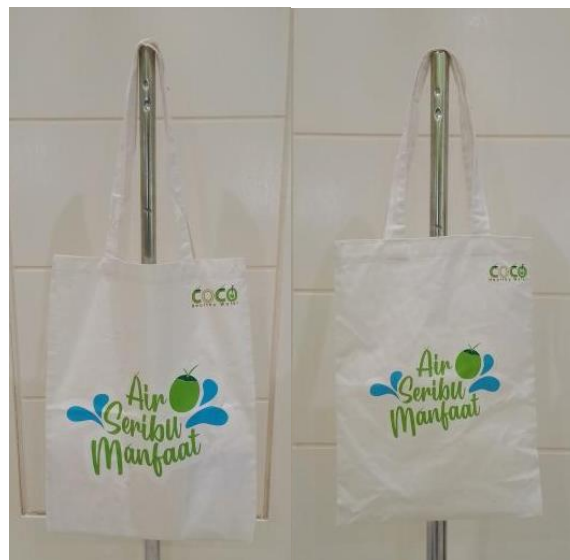
Gambar 9 Totebag

Media pendukung adalah media yang memuat informasi tambahan dari media utama dan media isu dengan tujuan untuk memperkuat pesan ataupun informasi yang disampaikan pada target.