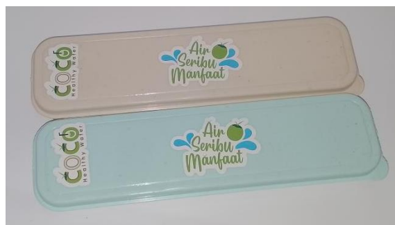
Gambar 15 Alat set makan