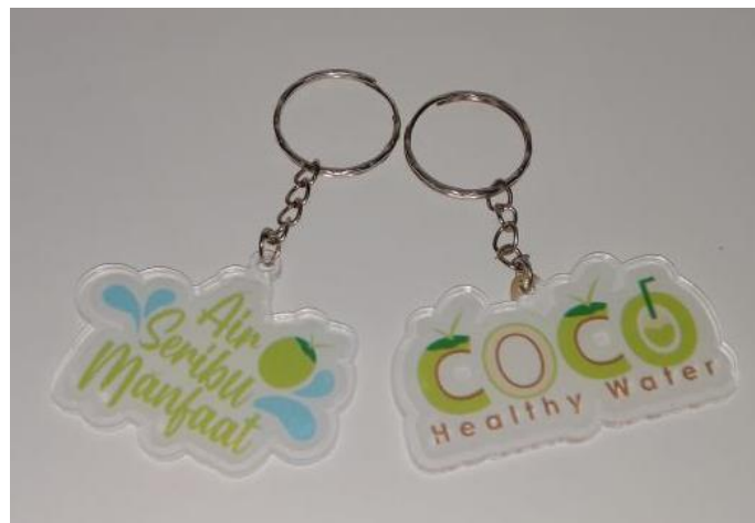
Gambar 18 Gantungan Kunci