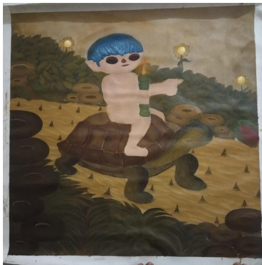
Gambar 1. "alon-alon penting kelakon" Acrylic on canvas, 100 x 100 cm. 2024.