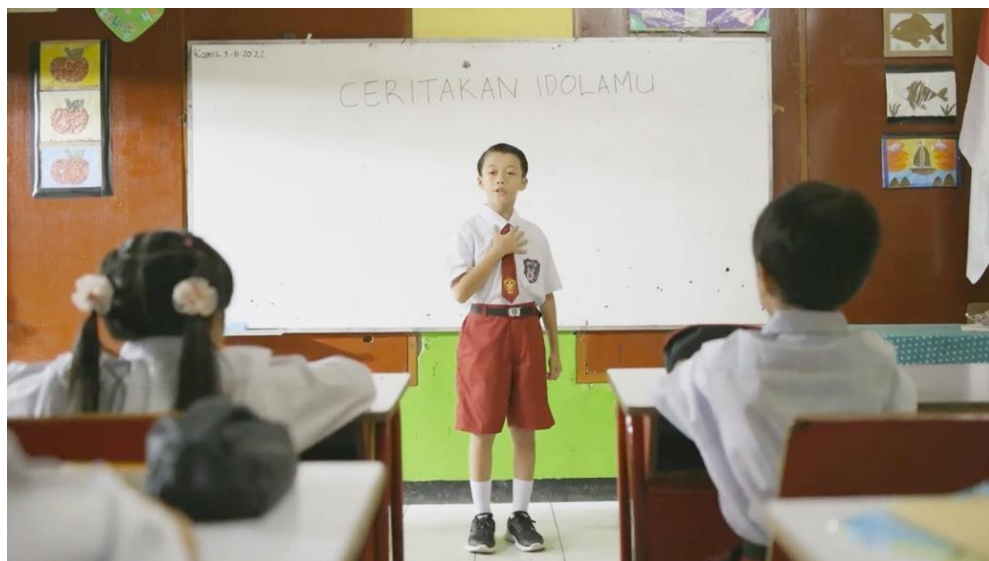
Gambar 1. Iklan Layanan Masyarakat Pencegahan Stunting