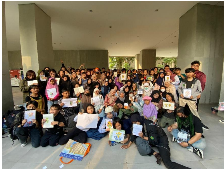
Gambar 2 Pertemuan Komunitas Mari Menggambar 5 Agustus 2024