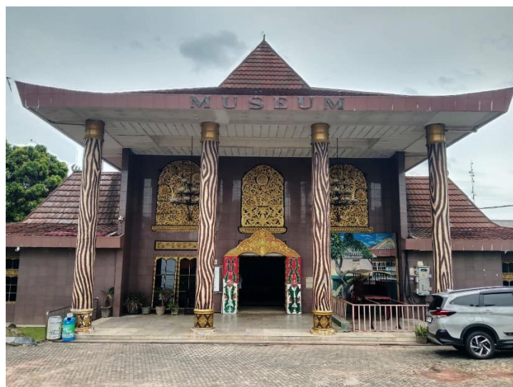
Gambar 1. Museum Balaputra Dewa

Pada tahap empathize , dilakukan observasi di Museum Negeri Balaputera Dewa untuk mempelajari bentuk otentik Rumah Ulu serta observasi di SDN 161 Palembang guna mengetahui pola belajar anak sekolah dasar. Wawancara dengan sejarawan, guru, orang tua, dan siswa juga dilakukan untuk menggali pengetahuan serta kebutuhan mereka terkait media pembelajaran budaya. Data yang diperoleh kemudian dianalisis pada tahap define untuk merumuskan masalah utama, yaitu rendahnya minat anak sekolah dasar terhadap budaya lokal karena dominasi teknologi dan terbatasnya media edukasi yang sesuai. Analisis ini diperdalam menggunakan pendekatan 5W+2H yang mencakup aspek what, who, why, when, where, how, dan how much . Berikut lokasi penelitian di Museum Balaputra Dewa, lihat gambar 1 di bawah.