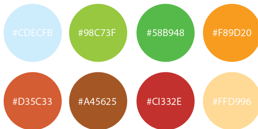
Gambar 4. Warna

Program kreatif selanjutnya adalah penggunaan warna di dalam perancangan ini, untuk lebih jelas lihat palet warna pada gambar 4 di bawah.