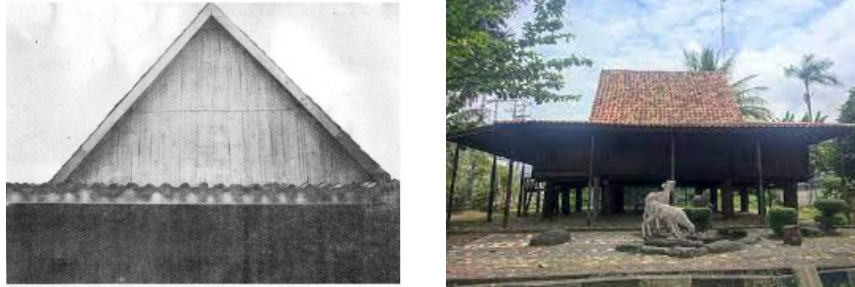
Gambar 2. Atap Rumah Ulu Ogan

memperindah bangunan, tetapi juga menjadi penanda identitas estetik dan filosofis dari rumah itu sendiri.