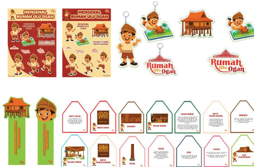
Gambar 10. Follow Up Media

Selain media utama, perancangan ini juga dilengkapi dengan media pendukung ( follow up media ) yang terdapat pada gambar 10 dan gambar 11 di atas. Tujuan utama dari follow up media tersebut adalah memperluas jangkauan komunikasi visual dan memperkuat identitas dari buku pop-up Mengenai Rumah Ulu Ogan . Media pendukung tersebut terdiri dari stiker, gantungan kunci, pin, pembatas buku, flashcard , brosur , dan X-banner . Setiap media dirancang dengan konsistensi visual yang sama, baik dari segi warna, ilustrasi, maupun tipografi, sehingga tercipta kesatuan identitas yang mudah dikenali. Stiker, gantungan kunci, dan pin dihadirkan sebagai media promosi yang sederhana namun efektif untuk meningkatkan kedekatan audiens dengan karakter Andak maupun logo Rumah Ulu Ogan.