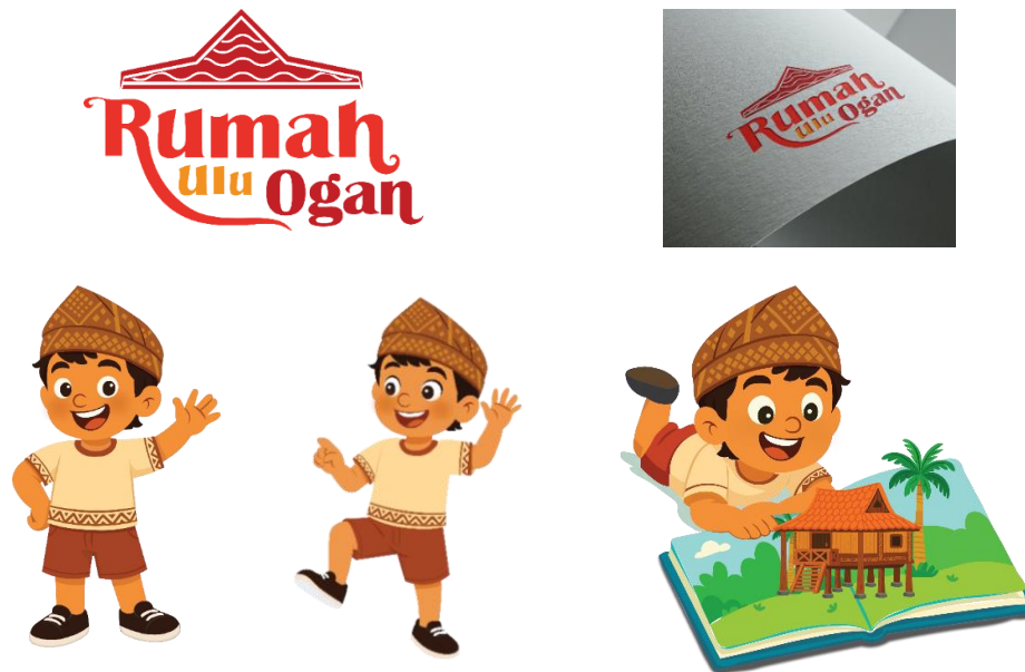
Gambar 9. Main Media

Pada gambar 9 di atas merupakan main media atau media utama yang digunakan dalam perancangan ini terdiri dari tiga bagian, yaitu buku pop-up "Mengenal Rumah Ulu Ogan", logo Rumah Ulu Ogan, dan maskot Andak. Ketiga media ini dikembangkan sebagai satu kesatuan visual yang saling mendukung dalam menyampaikan pesan budaya lokal kepada anak sekolah dasar. Buku pop-up dipilih karena memiliki daya tarik visual dan interaktif melalui elemen tiga dimensi yang mampu menghadirkan pengalaman belajar yang menyenangkan. Dengan ilustrasi bergaya flat design, buku ini membantu anak-anak memahami nilai budaya secara mudah, menarik, dan komunikatif.