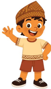
Gambar 3. Andak Karakter laki laki

Pada Gambar 3 di atas ditampilkan salah satu objek visual utama dalam perancangan komunikasi edukasi mengenai budaya lokal Palembang, yaitu ilustrasi tokoh anak bernama Andak. Karakter ini dirancang sebagai representasi anak lokal yang secara simbolis merepresentasikan generasi muda penerus budaya, sekaligus menjadi pemandu dalam memperkenalkan Rumah Ulu Ogan beserta nilai-nilai tradisional yang terkandung di dalamnya. Kehadiran Andak sebagai karakter utama dipilih karena mampu menghadirkan pendekatan visual yang komunikatif, bersahabat, dan mudah diterima oleh anak-anak sekolah dasar sebagai target audiens utama.