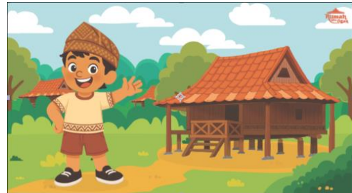
Gambar 8. Pre Media

Pada Gambar 8 di atas, menampilkan poster, feed Instagram dan video animasi yang dirancang oleh penulis sebagai media pendukung untuk memperkenalkan elemen-elemen penting dalam perancangan, seperti nama tokoh dalam buku pop-up mengenal Rumah Ulu Ogan, penjelasan singkat mengenai media yang dikembangkan, mengajak audience serta pengenalan elemen Graphic Standard Manual (GSM) dari logo. Media ini dibuat dengan pendekatan visual bergaya Flat yang sedikit dimodifikasi agar tetap selaras dengan nuansa budaya Kota Palembang.