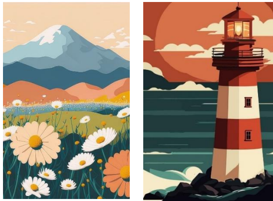
Gambar 7. Flat Design