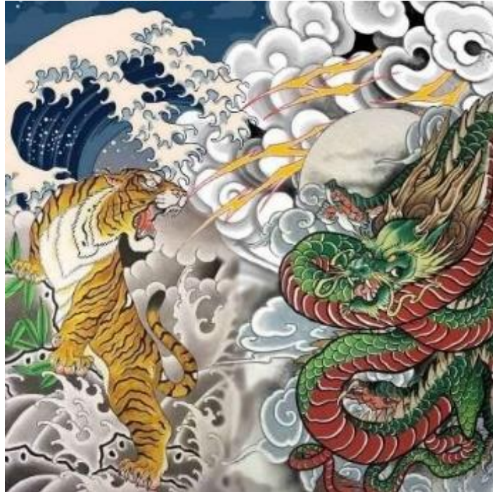
Gambar 7. " Dragon and Tiger "