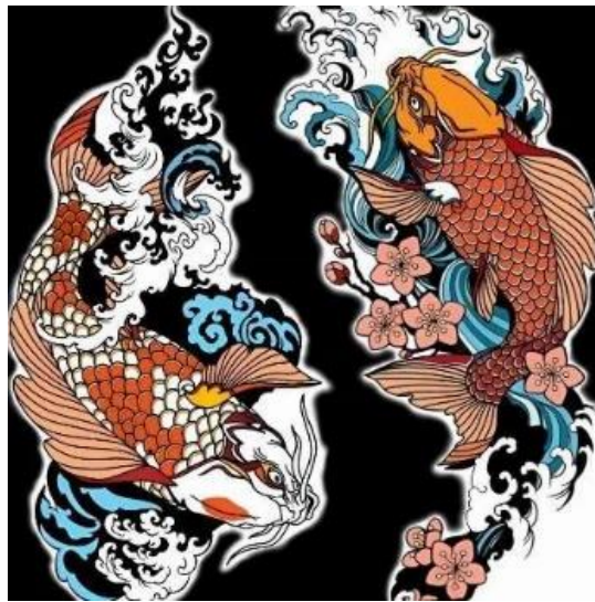
Gambar 2. "Up and Down"

Dari segi formal, ilustrasi pada gambar 2 menerapkan simetri yang fleksibel untuk menciptakan keseimbangan antara kedua elemen utama. Garis tegas pada tubuh ikan serta pola lengkung air menciptakan ritme visual yang dinamis. Gabungan warna cerah dari tubuh ikan dan bunga sakura dengan latar gelap menghasilkan efek dramatis yang mencolok. Rincian sisik serta pola air menggarisbawahi keahlian artistik pembuatnya, sementara elemen kabut dan ombak memperkuat ilusi kedalaman visual.