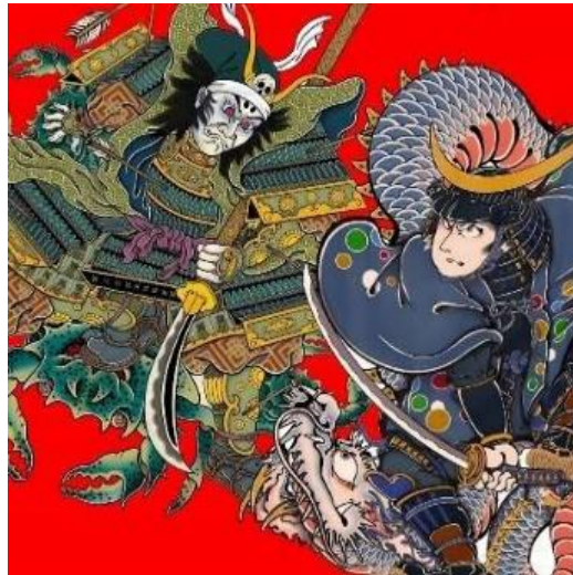
Gambar 3. "Samurai"

Karya pada gambar 3 berjudul "Samurai" ini menggambarkan dua sosok samurai yang terlibat dalam adegan intens dengan latar belakang merah cerah yang menonjolkan suasana dramatis. Kedua samurai mengenakan baju zirah tradisional Jepang yang kaya akan detail dan ornamen. Di sisi kiri, sosok samurai terlihat mengintimidasi dengan ekspresi tegas, rambut yang terurai liar, dan armor hijau tua berhias motif emas. Ia memegang tombak panjang yang diarahkan langsung ke lawannya. Di sisi kanan, lawannya mengadopsi sikap defensif dengan pedang terhunus. Armor biru gelap yang dikenakannya dihiasi ornamen penuh warna, memberikan kontras menarik dalam ilustrasi. Di bagian bawah, terdapat sosok naga yang tampaknya menjadi bagian penting dalam narasi epik tersebut.