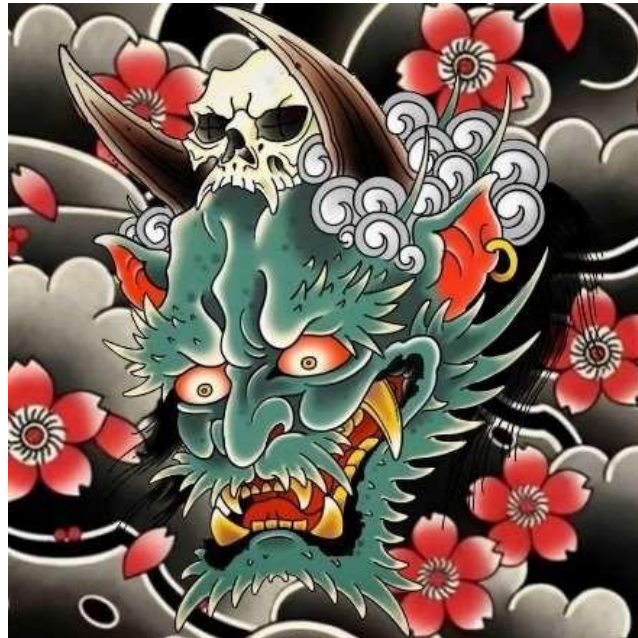
Gambar 6. "Green Oni"

Dari segi interpretasi, "Green Oni" mencerminkan perpaduan antara destruksi dan simbolisme budaya Jepang. Dalam mitologi, oni kerap merepresentasikan roh jahat atau kekuatan perusak yang membawa pelajaran atau karma. Keberadaan bunga sakura di latar belakang dapat digambarkan sebagai dualitas kehidupan: harmoni dan kekerasan, keindahan dan kengerian, kehidupan dan kematian. Tengkorak yang menghias kepala oni memperkuat aura mistis, menggambarkan keterkaitan tokoh ini dengan alam kematian.