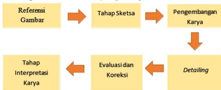
Bagan 2. Metode Penciptaan

Pada proses penciptaan karya tentunya melewati serangkaian tahapan untuk memperkuat ide, konsep, dan hasil akhir yang diinginkan, berikut alur tahapannya lihat bagan 2.