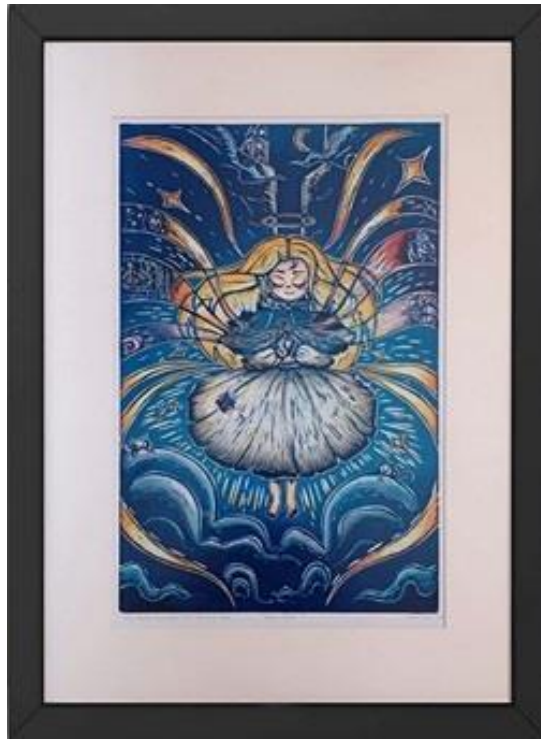
Gambar 1 Kilau Harapan