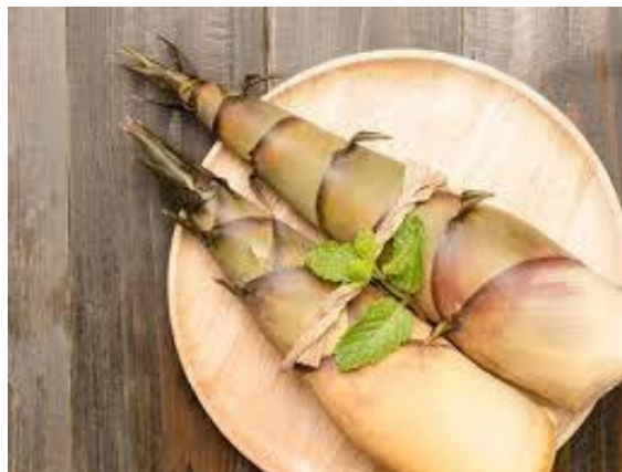
Gambar 4 Songket Pucuk Rebung

Gagasan ide dari motif pucuk rebung ini berbentuk seperti tunas bambu atau disebut dengan rebung. Adapun denotasi dari motif pucuk rebung ini merupakan representasi dari bentuk tunas bambu atau disebut dengan rebung, hal ini dapat dilihat pada gambar 4.