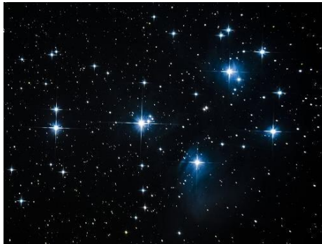
Gambar 2 Bintang

Gagasan ide dari motif tabur ini berbentuk seperti biji ketimun, bintik emas ataupun bintang. Adapun denotasi dari songket tabur ini merupakan representasi dari bentuk bintang, hal ini dapat dilihat pada gambar 2.