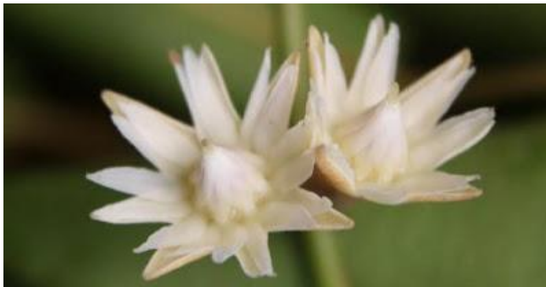
Gambar 6 Songket Bunga Tanjung Sumber : infolite.blogspot.com 2023

Gagasan ide dari motif Bunga tanjung ini berbentuk seperti Bunga tanjung yang memiliki sifat kelembutan. Adapun denotasi dari motif Bunga tanjung ini merupakan representasi dari bentuk Bunga tanjung, hal ini dapat dilihat pada gambar 6.