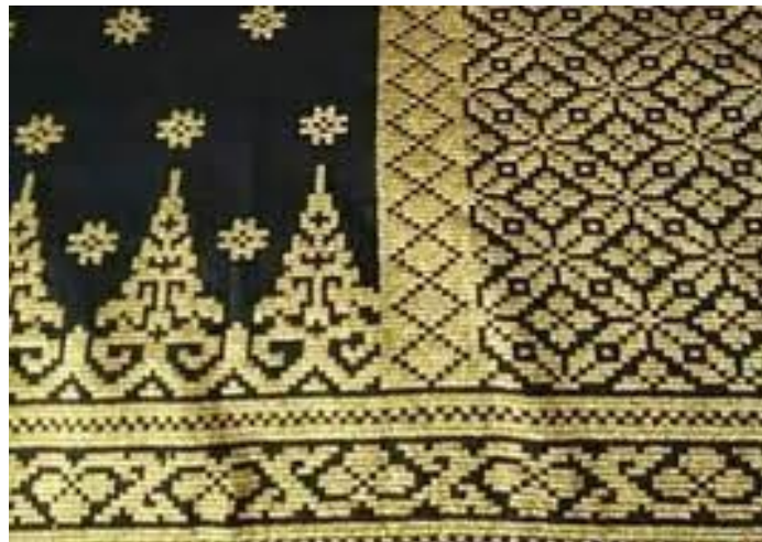
Gambar 3 Songket Pucuk Rebung

Gagasan ide dari motif pucuk rebung ini berbentuk seperti tunas bambu atau disebut dengan rebung. Adapun denotasi dari motif pucuk rebung ini merupakan representasi dari bentuk tunas bambu atau disebut dengan rebung, hal ini dapat dilihat pada gambar 4.