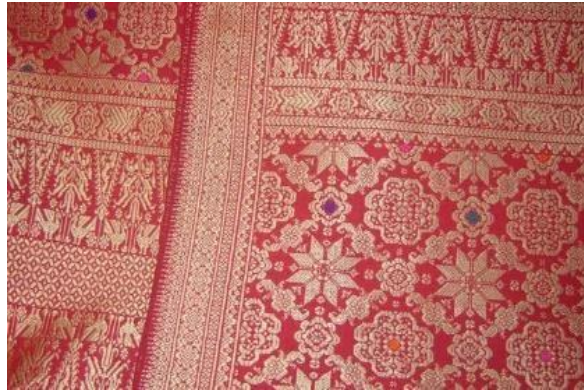
Gambar 5 Songket Bunga Tanjung

Gagasan ide dari motif Bunga tanjung ini berbentuk seperti Bunga tanjung yang memiliki sifat kelembutan. Adapun denotasi dari motif Bunga tanjung ini merupakan representasi dari bentuk Bunga tanjung, hal ini dapat dilihat pada gambar 6.