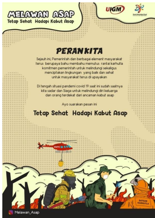
Gambar 3 Poster Melawan Asap 2, 2022