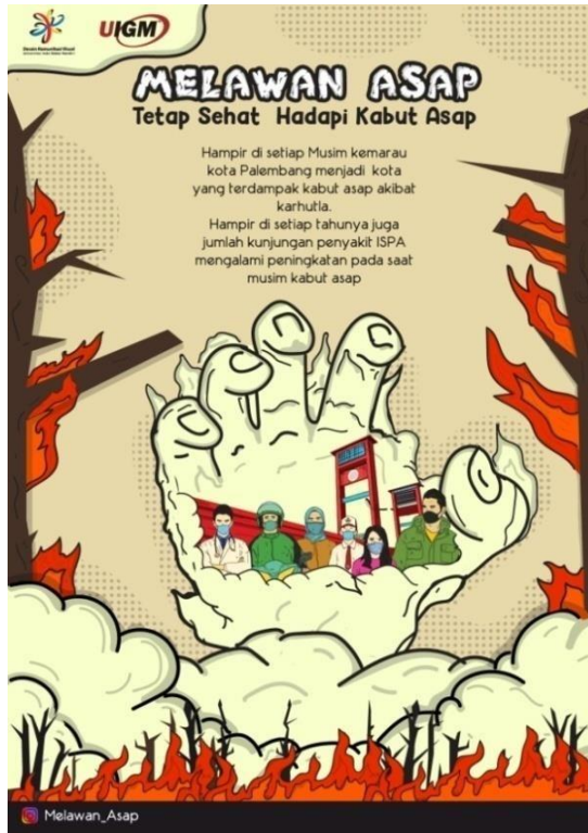
Gambar 2 Poster Melawan Asap 1, 2022