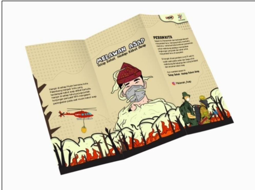
Gambar 4 Brosur Melawan Asap, 2022