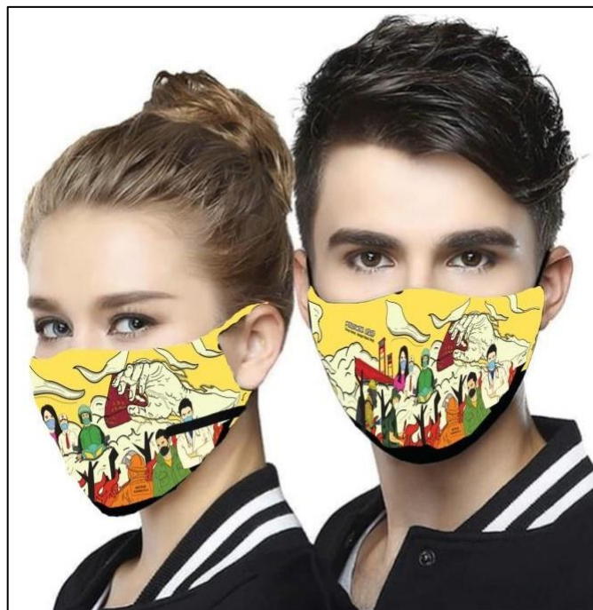
Gambar 7 Masker Melawan Asap, 2022