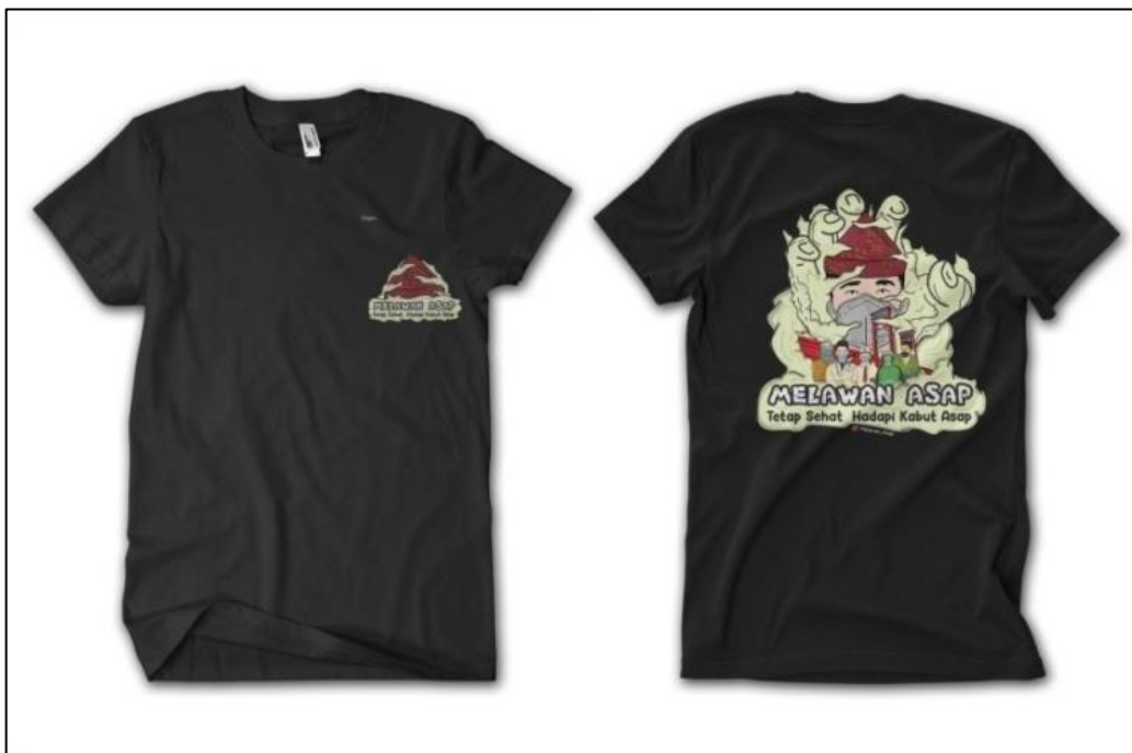
Gambar 5 T-Shirt Melawan Asap, 2022