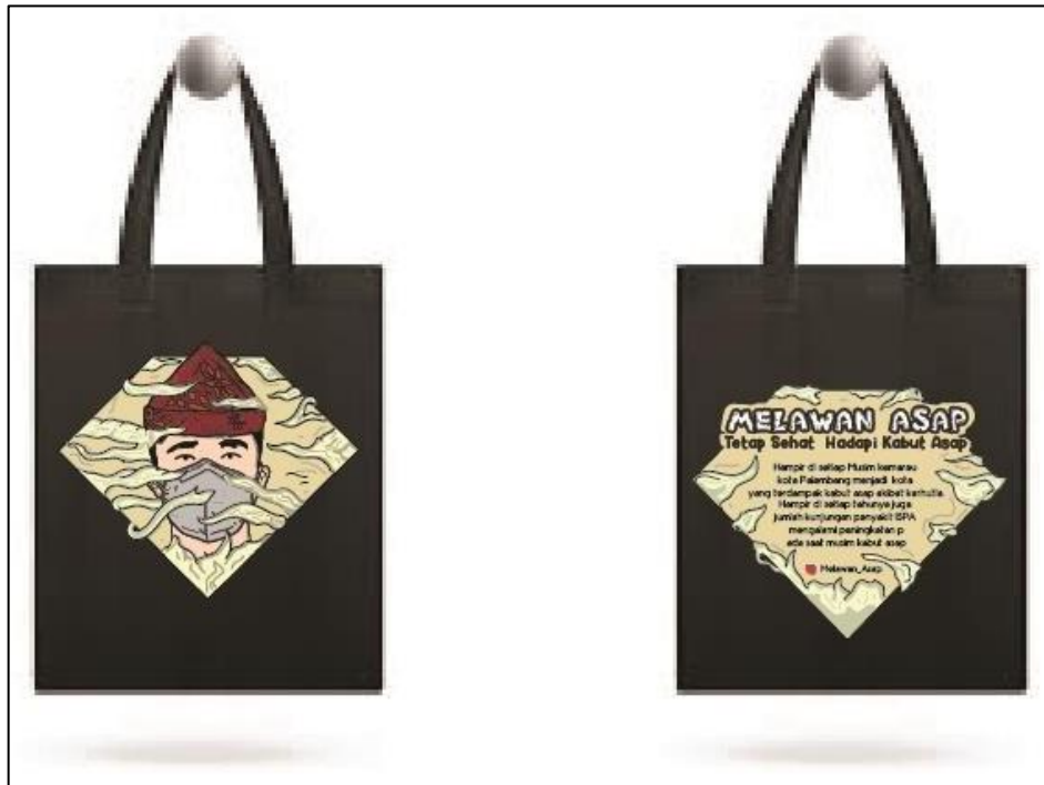
Gambar 6 Totebag Melawan Asap, 2022