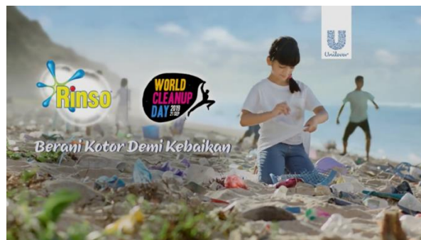
Gambar 1. Iklan Layanan Masyarakat Rinso "Yuk Mulai Bijak Plastik"

Penelitian sebelumnya yang membahas tentang iklan rinso "Yuk Mulai Bijak Plastik!" adalah penelitian yang dilakukan oleh Patriansah, dkk. Dalam penelitian ini membahas secara detail terkait pesan atau informasi yang disampaikan dalam iklan tersebut. Pesan atau informasi tersebut disampaikan melalui tanda verbal dan visual, maka dari itu, pendekatan yang digunakan dalam proses analisis iklan rinso tersebut menggunakan pendekatan teori semiotika Roland Barthes yakni tanda denotasi dan konotasi (Patriansah, 2022b). Namun demikian, penelitian ini tidak melihat serta meninjau dari aspek komunikasi dan pemasaran. Hal inilah yang menjadi fokus utama dalam penelitian ini.