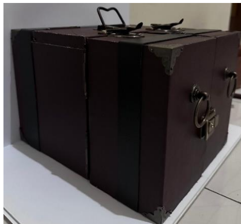
Gambar 3 Hasil akhir redesain kemasan '

Adapun hasil akhir stasiun kerja berupa redesain dari kemasan sederhana (tradisional), menjadi kemasan dengan desain mengikuti perkembangan zaman