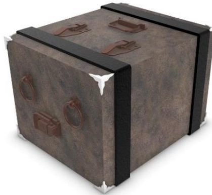
Gambar 2 Redesain kemasan 3D'