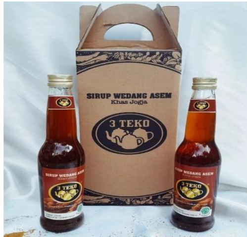
Gambar 1 Kondisi awal kemasan'