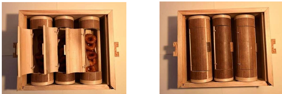
Gambar 8. Isi PR Packaging bagian bawah (3 Besek berisi Kue Ali Agrem)

Bagian bawah PR Packaging berisi empat besek kue, yang masing-masing berisi kue Ali Agrem. Besek-besek ini disusun dengan rapi sehingga tidak hanya memudahkan pengambilan tetapi juga menjaga keutuhan isi dari kue tersebut.