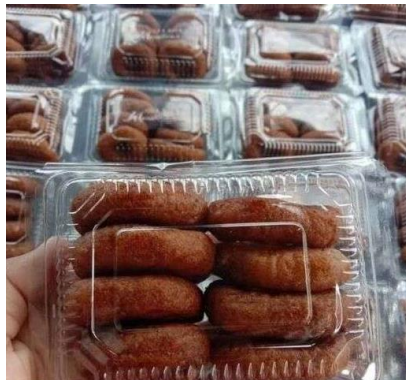
Gambar 2. Kemasan Kue Ali Agrem yang ada di pasaran

berjalannya waktu kue ini mulai jarang dijual dan susah ditemukan di toko kelontong terdekat, kini kue Ali Agrem bisa ditemukan di toko daring atau online shop. Meski begitu, kemasan kue Ali Agrem saat ini kurang menarik dan tidak merepresantasikan keunikan dan kekayaan budaya Sunda. Umumnya hanya menggunakan kemasan plastik, Desain kemasannya cenderung sederhana sehingga kurang mampu menarik perhatian konsumen. Oleh karena itu, diperlukan upaya untuk mendesain ulang kemasan kue Ali Agrem agar lebih menarik secara visual, menggambarkan nilai-nilai budaya Sunda, dan mampu bersaing di pasar modern yang kompetitif. Desain yang baru harus mampu mencerminkan identitas budaya sekaligus memenuhi kebutuhan estetika pasar saat ini, sehingga kue Ali Agrem dapat kembali populer dan dinikmati oleh lebih banyak orang.