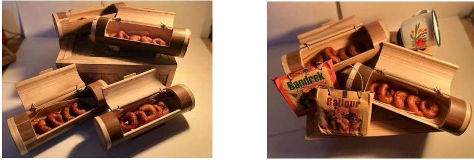
Gambar 9. Besek berisi Kue Ali Agrem beserta pelengkapya