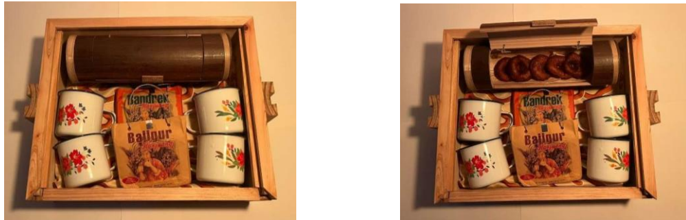
Gambar 7. Isi PR Packaging bagian atas (Kue Ali Agrem, Gelas jadul Enamel, Bandrek, dan Bajigur)

Bagian atas PR Packaging terdiri dari besek kue, bajigur, bandrek, dan gelas jadul enamel. Besek kue adalah wadah tradisional yang biasanya digunakan untuk menyimpan atau menghadirkan kue-kue tradisional. Bajigur dan bandrek adalah minuman tradisional khas Sunda, yang disajikan dalam gelas tradisional. Kombinasi ini memberikan nuansa budaya yang kental dan menarik.