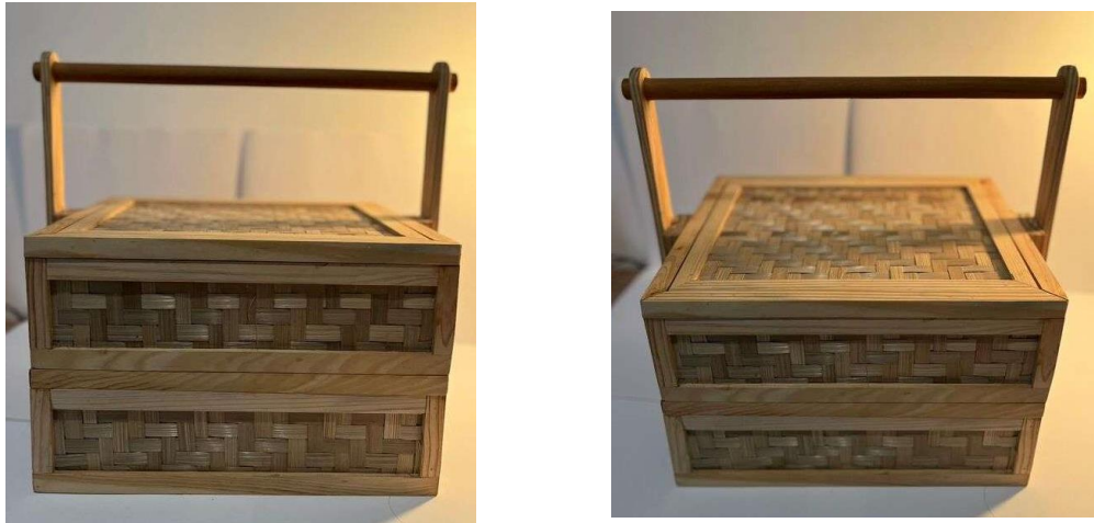
Gambar 11. Tampak depan PR Packaging