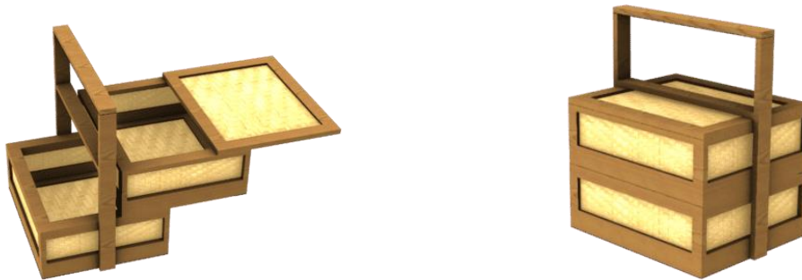
Gambar 5. Perancangan desain tiga dimensi (3D)

Setelah sketsa manual selesai, proses dilanjutkan dengan penggarapan desain tiga dimensi (3D). pada tahap ini, beberapa komponen desain PR Packaging diubah dengan menambahkan satu Tingkat kemasan menjadi dua Tingkat kemasan yang menyerupai sebuah rantang. Desain 3D dibuat menggunakan aplikasi CAD ( Computer Aided Design ) yang memungkinkan visualisasi kemasan lebih realistis dan mendetail. Tahap ini penting untuk memeriksa kesesuaian desain dan memastikan bahwa setiap komponen berfungsi sebagaimana mestinya.