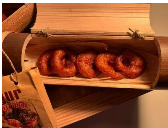
Gambar 1. Kue Ali Agrem

Salah satunya adalah Kue Ali Grem, Kue Ali (ledram) merupakan salah satu kue tradisional khas Sunda yang berasal dari Karawang, yang berbentuk mirip dengan donat (Dishub Karawang, 2018). Perbedaan antara donat dan kue Ali terdapat pada komposisi bahan, rasa, dan teksturnya. Kue Ali juga dikenal sebagai kue ledram, karena memiliki bentuk yang menyerupai cincin, yang dalam sunda berarti Ali. Kue ini terbuat dari campuran tepung beras dan gula merah. Umumnya, Kue Ali dihidangkan dalam berbagai acara adat di Masyarakat Sunda, seperti pernikahan, khitanan, dan juga perayaan agama seperti Idul Fitri.