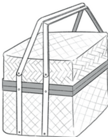
Gambar 4. Sketsa Awal Pr Packaging

Proses perancangan diawali dengan membuat sketsa secara manual, sketsa ini merupakan rancangan awal sebelum masuk ke tahap berikutnya. Sketsa ini memberikan Gambaran visual dan dasar konsep. Mengeksplorasi ide-ide awal dan menentukan komponen-komponen yang akan dimasukkan ke dalam desain akhir.