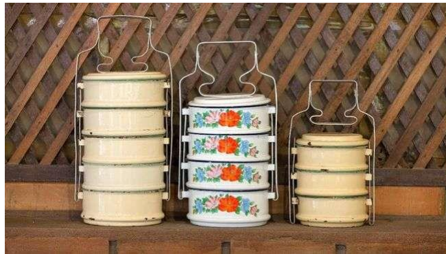
Gambar 3. Contoh Rantang Tradisional

lainnya. Rantang merupakan tempat makan berbentuk silinder dan memiliki 4 tumpukan wadah bulat dengan 1 tutup pada bagian atas. Biasanya terbuat dari logam, rantang terdiri dari beberapa lapisan atau tingkat yang bisa dipisahkan, di mana setiap lapisan berfungsi untuk menyimpan berbagai jenis makanan. Rantang sering digunakan untuk membawa makanan saat bepergian atau untuk menyajikan hidangan kepada tamu. Umumnya rantang berisikan aneka lauk-pauk yang tersusun mulai dari nasi, ikan atau ayam, sayur mayur, serta kerupuk atau cemilan pada tumpukan bagian atas.