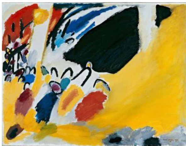
Gambar 2 " Impression 3 (concert) "

Warna hijau adalah warna yang tenang, menurut Kandinsky warna hijau ini dapat dilihat dalam suara violin. Putih merupakan warna akan kesunyian dimana melodi akan suatu musik berhenti sejenak. Berbeda dengan warna putih, warna hitam sendiri merupakan representasi akan kekosongan melodi yang biasanya terdapat di dalam akhir dari musik tersebut. Warna merah muda sendiri menggambarkan suara terompet yang keras dan kuat sedangkan warna maroon merupakan suara dari nada tengah cello. Suara violin digambarkan oleh warna orange dan warna violet merupakan gambaran dari suara terompet. Warna biru sendiri memiliki spektrum warna yang sangat luas, biru muda dapat menggambarkan flute . Jika lebih gelap maka biru tersebut dapat menggambarkan cello. Biru navy digambarkan dengan double bass kemudian warna biru yang paling gelap dapat menggambarkan suara dalam organ. Kandinsky ingin menemukan cara untuk mengkomunikasikan karya seninya hanya dengan menggunakan warna, hal ini dapat dilihat dari lini karya Kandinsky dengan judul " Impression 3 (concert) ".